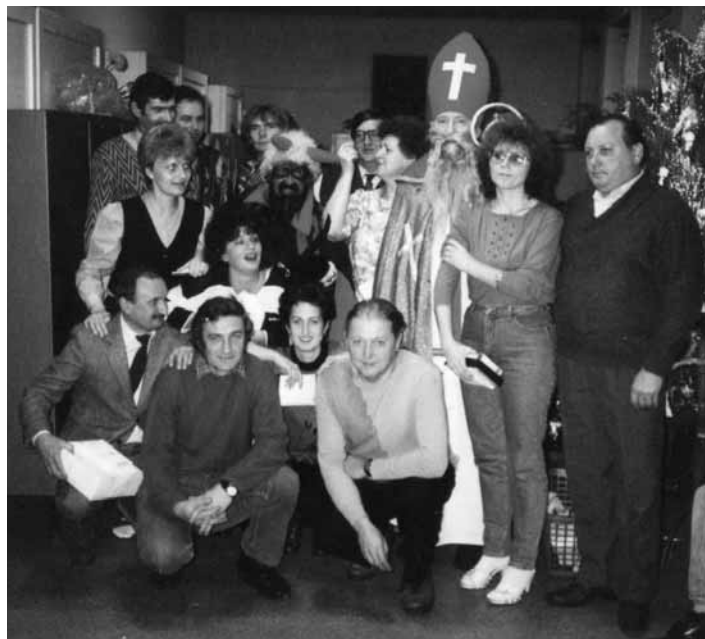
Mikuláš, rok 1992, Rudné Bane

vieš dobre, že sme spolu s čertom od roku 1991 na základe pozvania pracovníkov mestskej kultúry robili Mikuláša a čerta v meste a na koči sme každoročne prešli cez Križovatku, Drieňovú, až na Trojicu.