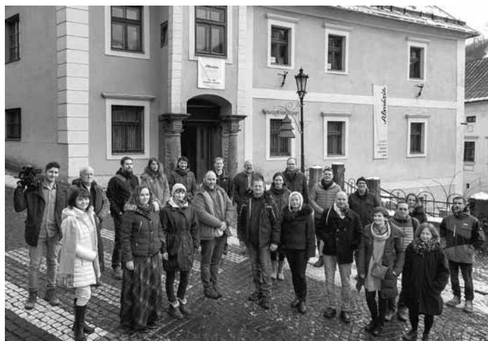
Projektový tím Mesta kultúry 2019

Vizuálne umenie v uplynulom roku prinieslo mnoho zaujímavých aktivít. Počas roku 2020 sa budeme naďalej stretávať s výstavou 346, kto-