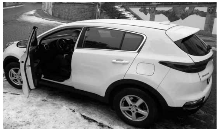
Kia Sportage s klimatizáciou

„S novým vozidlom sme zatiaľ maximálne spokojní, je spoľahlivé a sám som prekvapený, že KIA Motors vyrobila takéto vozidlo. Auto v súčasnosti testujeme, musí mať pre zábeh najazdený určitý počet km a v najbližšej dobe dôjde k označeniu vo-