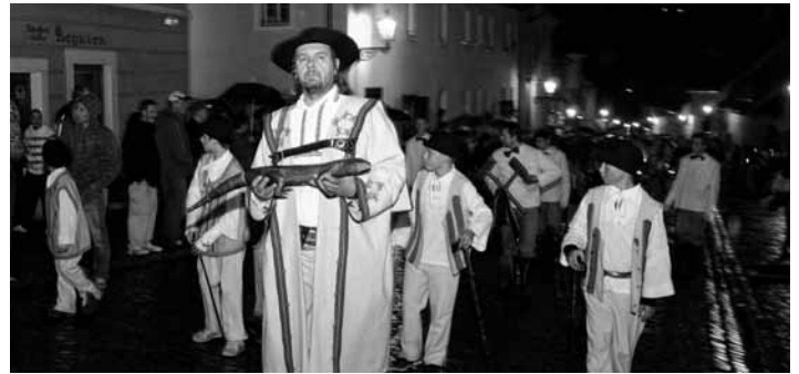
Čelo Salamandrového sprievodu

Banskostiavnický Salamander je rozhodne jedinečným podujatím v slovenskom kontexte. Slávnostné pochody baníkov sú starobyľou tradíciou