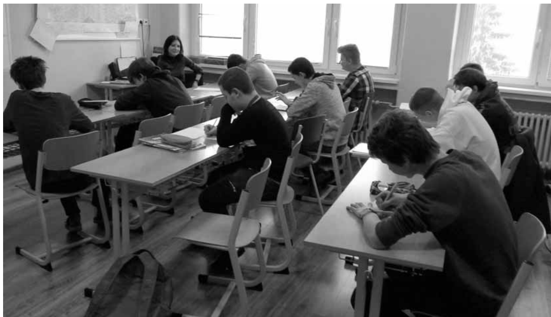
Učebňa mladých programátorov

„V 1. ročníku máme už prvé dievča, ktoré si pestujeme ako náš draho-kam. Dievčatá sú vzácne, ale o to viac si ich vážime. Navyše je to príjemné