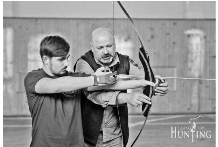
Mladý lukostrelca s loveckým inštruktormom