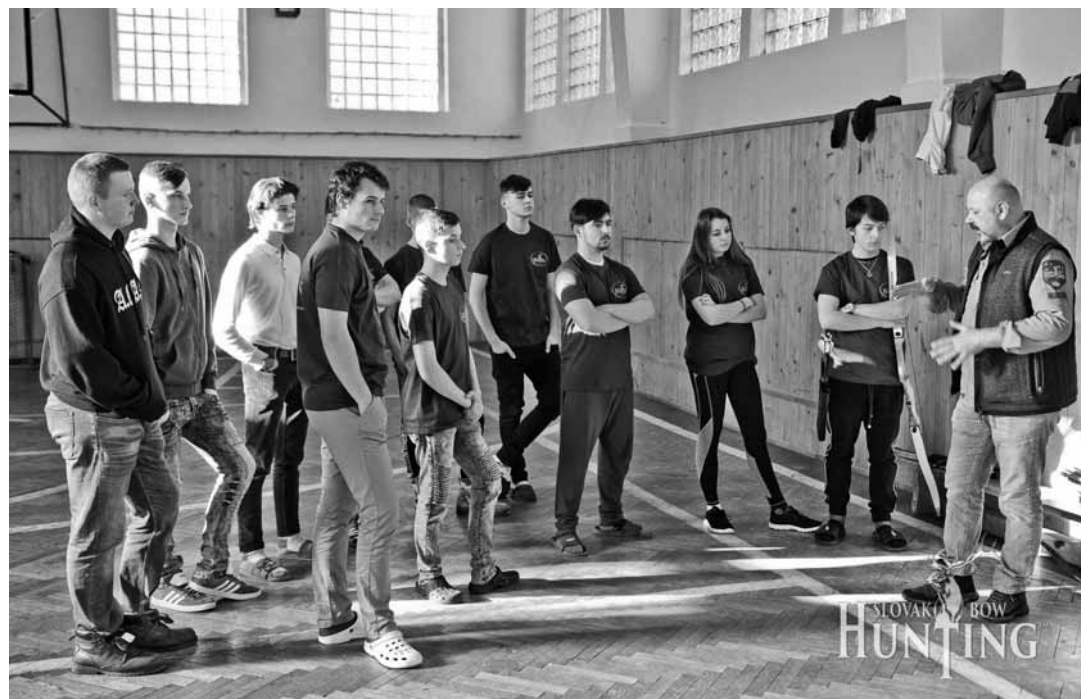
Študenti Strednej odbornej školy lesníckej v Banskej Štiavnici