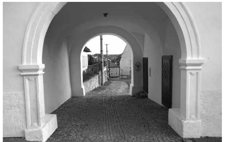
Prechod popod Piargsku bránu

„Obnova fasády tejto národnej kultúrnej pamiatky bola veľmi náročná, mno-