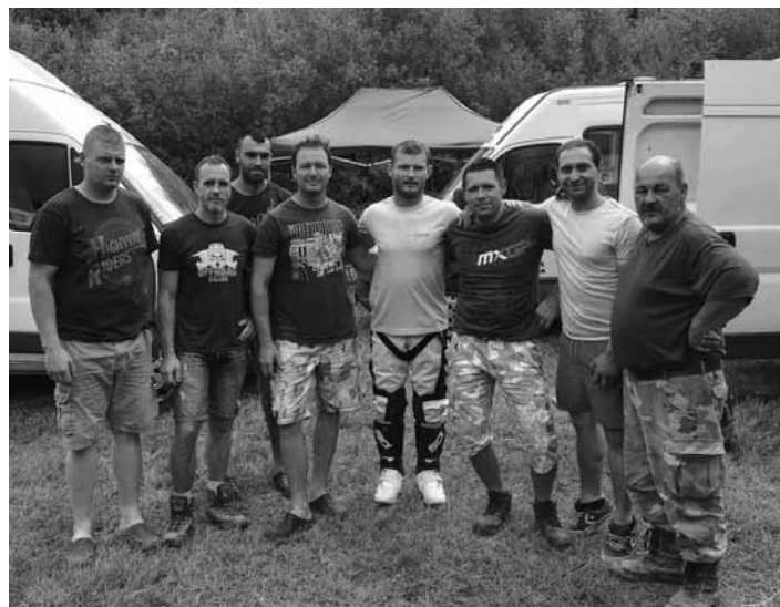
Motocyklisti z nášho okresu

Výsledky jednotlivých športovcov si môžete pozrieť aj na www.smf.sk .