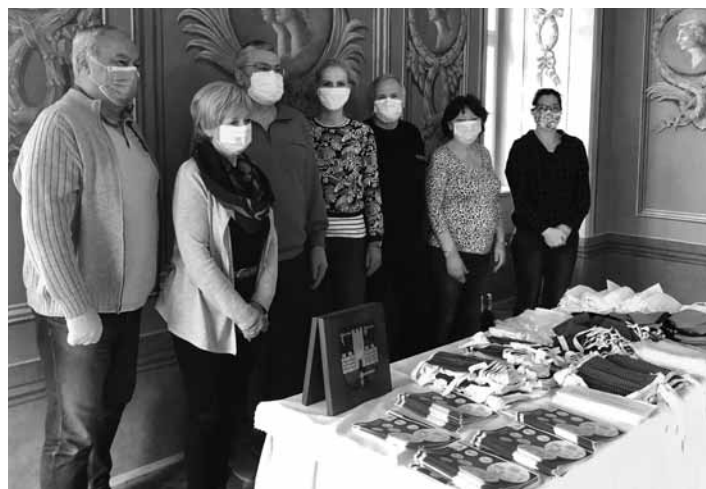
Krízový štáb mesta Banská Štiavnica

Činnosť mestského úradu je obmedzená na telefonickú a elektronickú komunikáciu. Úradné hodiny sú pondelok, streda a piatok 8.00 - 11.00 hod., kontakt so za-