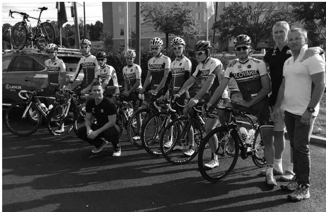
Cyklistický Team Firefly

„Tím má momentálne 6 aktívnych cyklistov, súťažiacich na slovenskej,