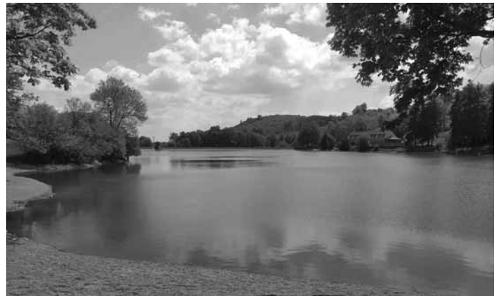
Tajch Vindšachta

Spodná Vindšachta a Evička už totiž svojou kapacitou nepostačovali. So stavbou sa začalo v roku 1712, v roku 1713 požiadal M. K. Hell o zvýšenie hrádze o 5 metrov, návrh bol zrealizovaný a v roku 1715 bol tajch dokončený. Vyskytli sa však problémy s tesnosťou hrádze, ktorá bola v nasledujúcich rokoch viackrát spevňovaná. V roku 1729 hrádzu opravovali pod vedením Samuela Mikovíniho, ktorý navrhol a zrealizoval aj výstavbu prírodných jarkov tohto tajchu. V roku 1788 sa hrádza opäť zvyšovala, tentoraz o 2,5 metra a to na základe 50 rokov starého Mikovíniho návrhu, čím sa tajch dostal na súčasné parametre. Hrádzu využívali od začiatku miestni obyvatelia ako cestu na vyhánanie dobytku na pastviny, počas dažďov na nej stála voda. Tieto faktory ovplyvňovali jej posadenie, a preto bola následne ešte viackrát opravovaná. Neskôr v 20. storočí bola pod korunou hrádze zriadená štátna cesta a zvyšujúca sa premávka začala opäť spôsobovať problémy s posadením hrádze, ktoré vyvrcholili v 70. rokoch 20. storočia, keď sa uvažovalo o úplnom zrušení cesty, aby nedošlo k jej ďalšiemu poškodeniu. Hrádza však bola opäť spevnená. Tajch Veľká Vindšachta je spolu s nižším tajchom Evička už storočie vyhľadávaným strediskom oddychu, rekreácie a vodných