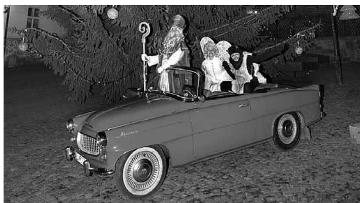
Mikuláš, čert a anjel na Nám. sv. Trojice 3.str.

Zvlášť tento rok, ktorý preveruje naše životy po každej stránke, priniesol mnoho odriekania. A tak sa tešíme na každoročné stíšenie v duši, potešenie z radosti našich detí a snád' aj pochopenie širších súvislostí v našich životoch. Vstupnou bránou do tohto čarovného obdobia je sviatok sv. Mikuláša. Najznámejší príbeh o sv. Mikulášovi pozná snád' každý.