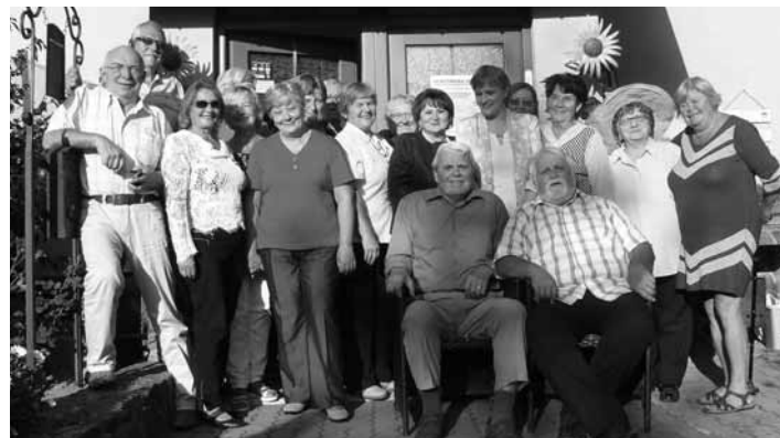
Aktívni seniori z Piargu

https://www.cewe-community.com/sk/galeria/book/60646#