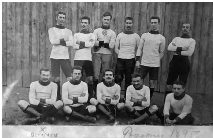
Bratislavský klub z r. 1895 (na foto x F. Gootpreis)

Do nášho mesta Banskej Štiavnice doniesli túto magickú hru študenti-vysokoškooláci, ktorí sem prišli študovať na vtedajšiu Banícku a lesnícku akadémiu, ktorú založila v r. 1762 cisárovná Mária Terézia. Futbal hrávali na priestranstvách, hlavne na lúke pri železničnej stanici a týmto spôsobom zoznamovali domáчих s futbalom. Hra sa im zapáčila, a tak svetlo sveta uzrel 1. oficiálny propagačný zápas v histórii mesta, a to 2. júna 1904 a pre veľký úspech a záujem nasledoval odvety zápas dňa 5. júna 1904. Je tomu neuveriteľných skoro 120 rokov, žiaľ, aktéri, ktorí položili základy tejto magickej hry zostali pre nás neznámi. Život je však nevy-