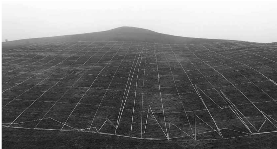
Technický graf na „lógroch“ okolo Kalvárie