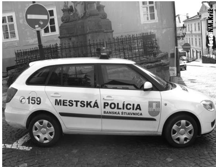
Poslanci MsZ schválili nákup vozidla Škoda Fabia Combi pre Mestskú políciu