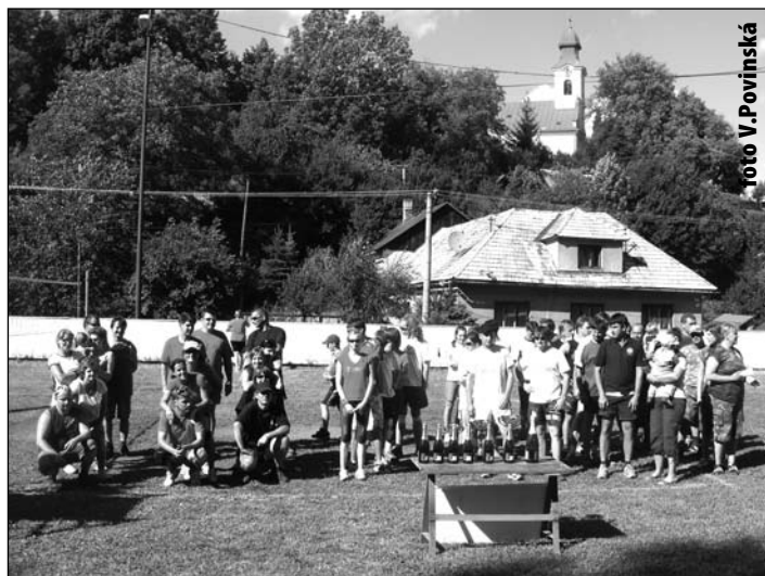
Púťový volejbal na ihrisku pri Kultúrnom dome Štefultov