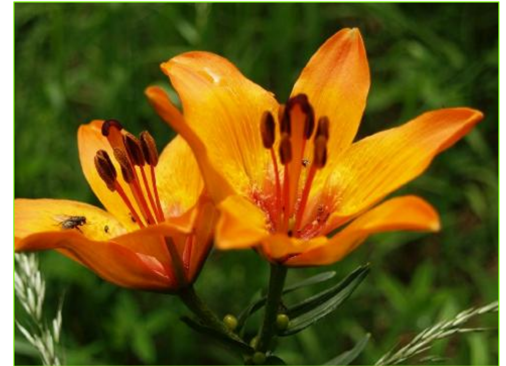
Ľalia cibuľkonosná ( Lilium bulbiferum )

Výkres ilustruje charakteristických zástupcov a prírodné hodnoty v území. na jednotlivých vybraných príkladoch .