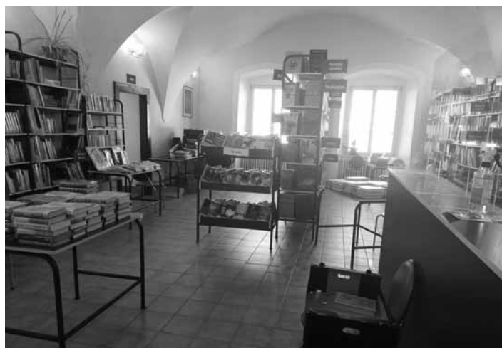
Vstup do mestskej knižnice

KK: „Prestávka bola naozaj veľmi dlhá. Trvala od konca decembra až doteraz a ešte stále nie sme za vodou,