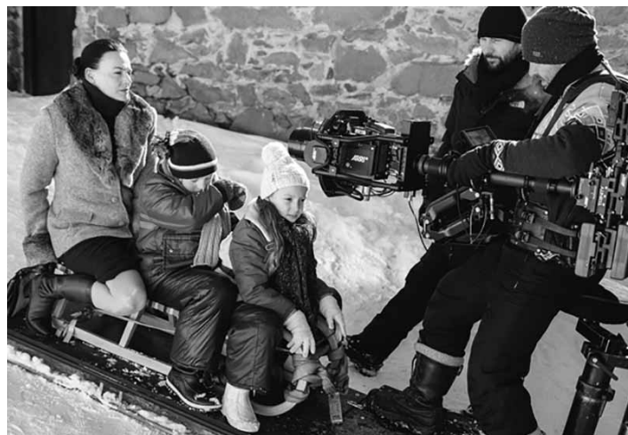
Záber z natáčania filmu v Banskej Štiavnici

skej Štiavnici, to bol slnkom zaliaty čas. Do obrazu sánkovania som si želala namrznutý, ligotajúci sa sneh, modré nebo a všetkých blízkych zdravých – to sa splnilo. Bola to radosť,“ dopĺňa režisérka.