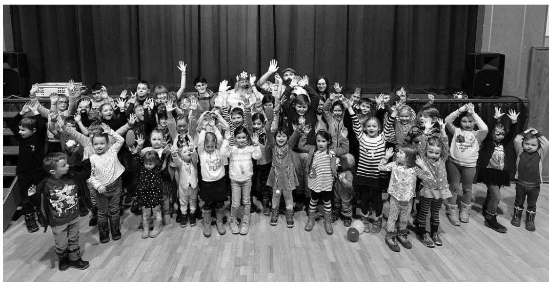
Detská radosť v kultúrnom centre

V rámci komnaty zábavy im k tomu pomáhali moderátor Forgi a divadelné predstavenia v divadiel Crocus, Babadlo a Harry Theatre. Tie priniesli príbehy lišákov Dollara a Binga, Psíčka a Mačičky i Fónky a Tónky z Gramofónie.