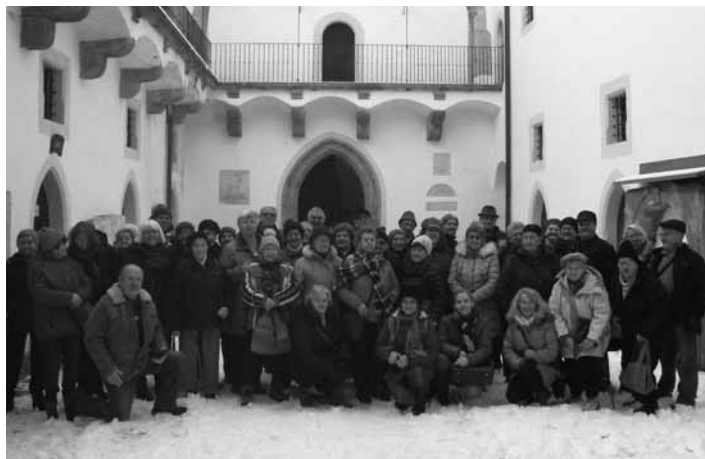
Členovia SZTP na nádvorí Starého zámku

Potom naša cesta pokračovala do miestnosti, kde sme si pozreli výstavu – Kalvária v azyle. Sú tu zachované originály z Kalvárie, ktoré predstavujú 17 vzácných drevených