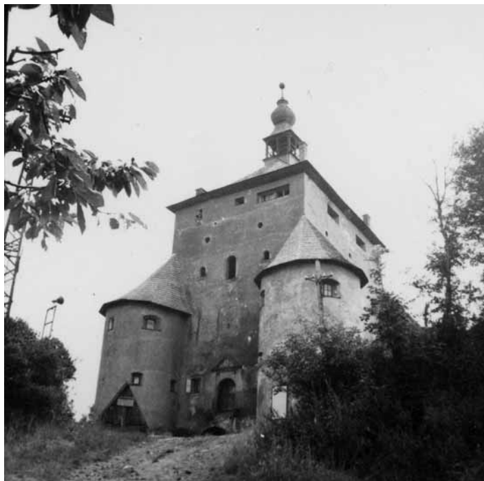
Nový zámok (1564 – 1571) zohral významnú úlohu v ochrane pred Turkami

16. a 17. stor. bolo mimoriadne ťažké pre obyvateľov Uhorska, a teda aj územia Slovenska, ktoré bolo už od 10. stor. súčasťou Uhorska. V r. 1526 utrpeli uhorské vojská od Turkov pri Moháči katastrofálnu porážku a v r. 1541 padol do rúk Turkov aj Budín – hlavné mesto Uhorka. Tým sa stalo nebezpečenstvo Turkov akútnym aj pre celé