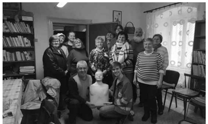
Prednáška o poskytnutí prvej pomoci

Je naozaj obdivuhodné, že aj v dnešnej dobe sa nájdu mladí ľudia,