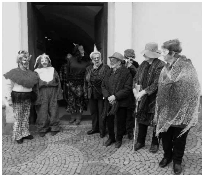
Príprava pred fašiangovým sprievodom

Už od skorých ranných hodín viaceré členky začali pripravovať tradičné fašiangové pampúchy. O 12,30 hodine navštívili náš klub klienti z OZ Margarétka, ktorí nám tiež vo svojich maskách zapievali zatancovali, my sme ich na oplátku pohostili pampúchmi a čajom. Už preoblečení do masiek sme sa spolu s nimi vyfotili a po ich odchode sme išli za sprievodu harmoniky a spevu po meste. Navštívili sme reštaurácie na Nám. sv. Trojice a prešli sme až do Pizzerie sv. Barborky. Vracajúc sa do nášho klubu, zastavili sme sa na Radnici, kde práve zasadalo Mestské zastupiteľstvo. Zaspievali sme im, ponúkli našimi pampúchmi a potom sme pokračovali do Klientskeho centra. Cestou si nás fotografovali jednak Štiavniča-