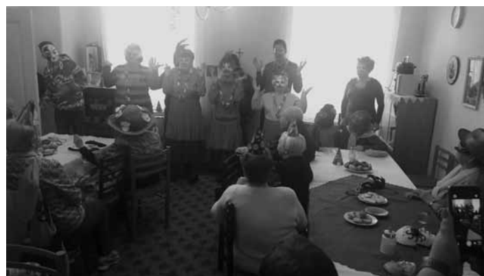
Klienti DSS navštívili DC Štefultov

Hneď po príchode sa mládež, ale i personál prispôbil duchu fašiangov svojím oblečením a maskovaním do pestrofarebných kostýmov. Nečudo, veď seniori z DC ich už čakali v prestrojení masiek. Po malej kultúrnej vložke, ktorú