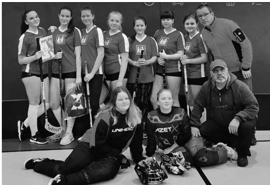
Víťazné družstvo v kategórii žiačok ZŠ - ZŠ J. Kollára B. Štiavnica