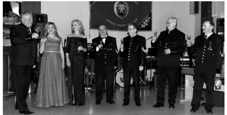
Otvorenie 20. celoslovenského plesu