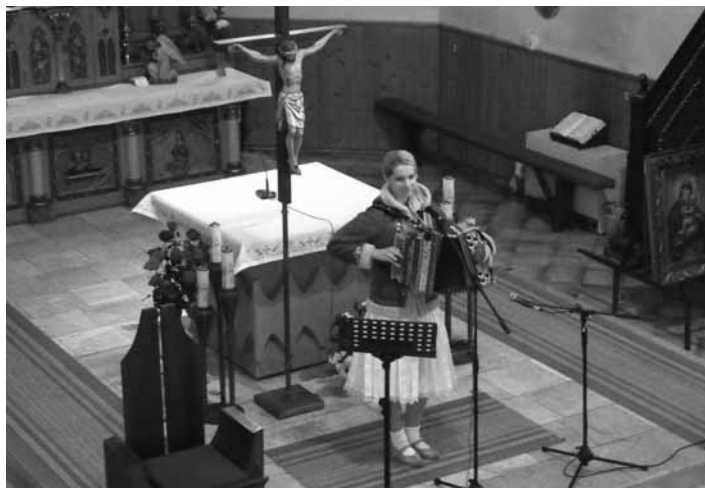
Vystúpenie slovenskej speváčky