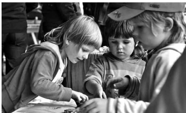
Tvorivé dielničky pre deti

V realizácii máme momentálne ďalšie dva projekty Fondu na podporu umenia. Jeden je zameraný na doplnenie knižničného fondu, druhý na podujatia v Bode K. Druhý uvedený projekt, žiaľ, zásadne zasiahla pan-