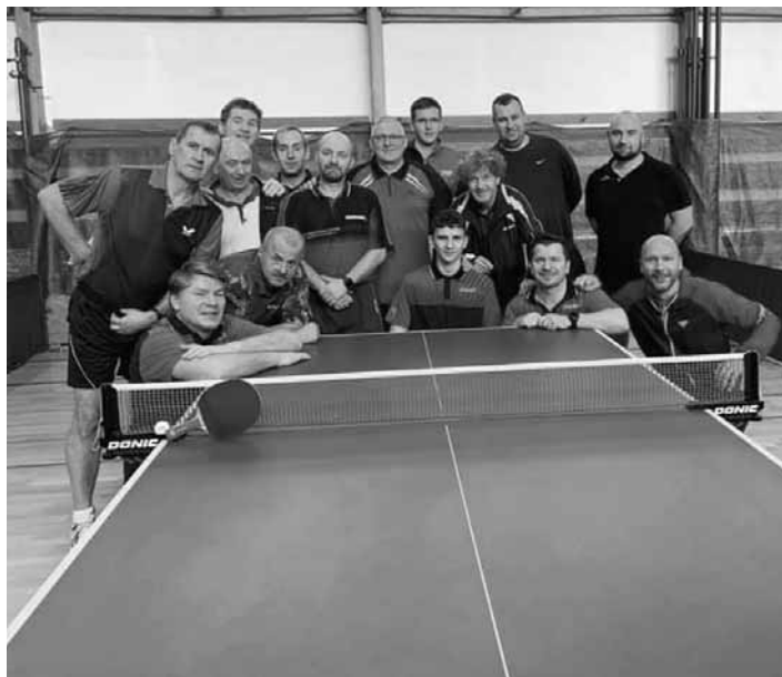
Stolnotenisový klub Banská Štiavnica

V roku 2020 sme v odvetnej časti sezóny odohrali 7 kôl a zvyšné 4 kolá boli zrušené. V tejto krajskej súťaži sme hrali so striedavými úspechmi, ale hlavný cieľ udržať túto súťaž aj pre ročník 2021 sa nám podarilo splniť.