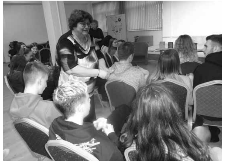
Rozprávanie mladých ľudí inšpirovalo