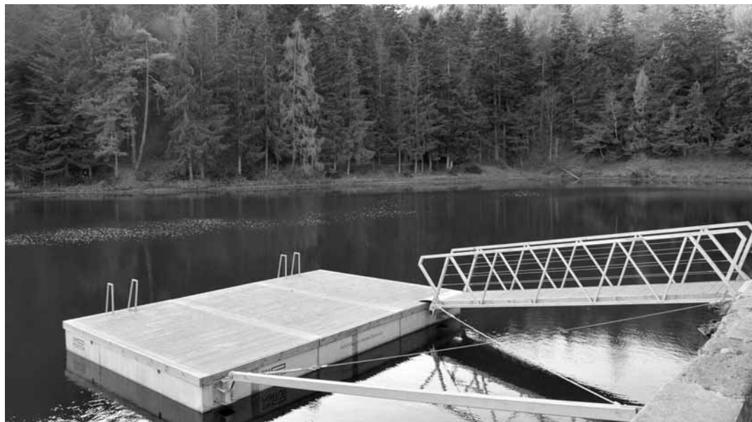
Tajch Klinger- jeden zo svetoznámych tajchov v okolí BŠ, ktoré sú zapísané v Zozname svetového dedičstva UNESCO