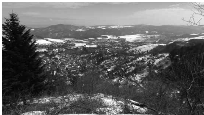
Zimná panoráma mesta

V tomto roku 2021 poznávacia turistika začína na trojičnom námestí v Banskej Štiavnici. Pokračujeme po trase vyznačenej červenými šípkami, schodmi na Hornú ružovú ulicu a odtiaľ na náučný chodník Ganzenberg. Tento chodník prechádza ponad Veľký Vodárenský tajch i Malý Vodárenský tajch na Červenú studňu, pokračuje Hornohodrušským jarkom, cez opustený kameňolom a pod nefunkčným tajchom na Teplom potoku, až nad pamätníku 2. svetovej vojny. Následne zatáča vľavo do kopca, zväznicou nad zadné Rosniarky a po ceste pokračuje na Veterné sedlo (horná