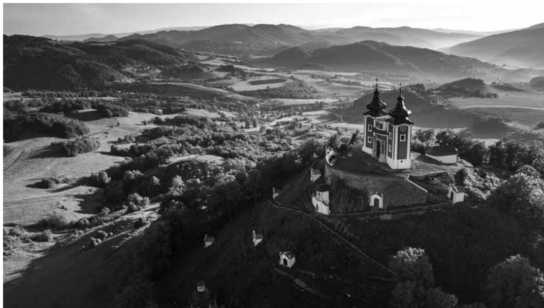
Pohľad na dominantu mesta Banská Štiavnica - Kalváriu