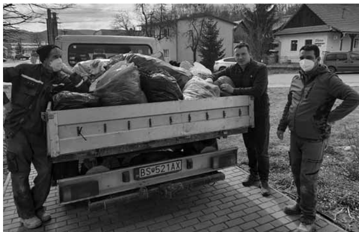
Dobrovoľná zbierka pre KC Šobov