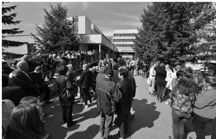
Protestné zhromaždenie pred nemocnicou

Je síce pekné a chvályhodné, že Svet zdravia a.s. chce rekonštruovať budovy nemocnice v Žiari nad Hronom a tak zlepšiť podmienky zdravotníctva pre spádovú oblasť, a určite nie som z tých, ktorí takúto chvályhodnú iniciatívu nepodporia, aby mali ľudia lepšie zdravotné podmienky, ale na druhej strane treba otvorene povedať, že dnes kedy dochádza k presťahovaniu oddelení (interného a gynekologic-