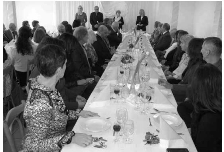
Naši pedagógovia so samosprávou

Primátorka mesta v príhovore ocenila náročnú prácu učiteľov vo všetkých kategóriách a vyzdvihla aj zodpovednú prácu riaditeľov škôl a školských zariadení v ich pozícii vedúcich pedagogických zamestnancov, ktorí sa čoraz viac stávajú dobrými manažermi svojich škôl. Prítomným poďakovala a ubezpečila o pripravenosti mesta a mestskej samosprávy otvorene diskutovať a riešiť problematiku celého banskštiavnického školstva tak, aby sa zachovala dlhoročná tradícia nášho mesta ako „mesta škôl.“