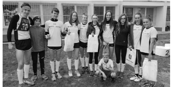
Ocenení bežci z ŠK Atleti BS