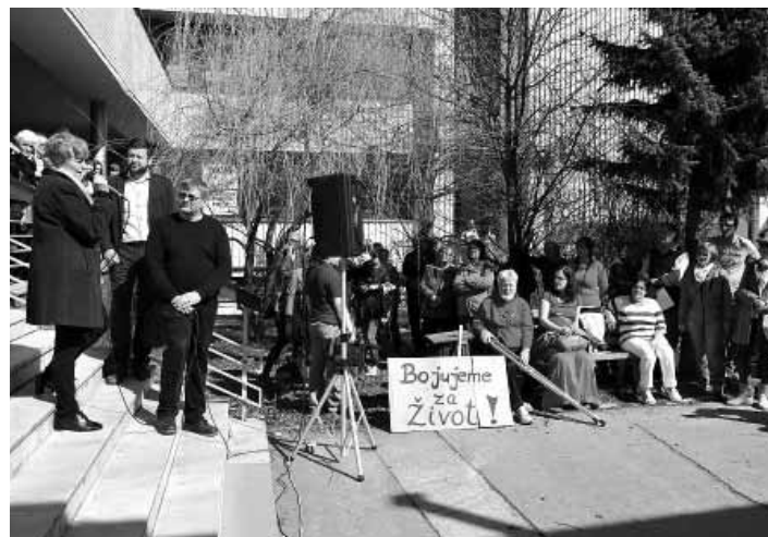
Primátorka mesta na zhromaždení