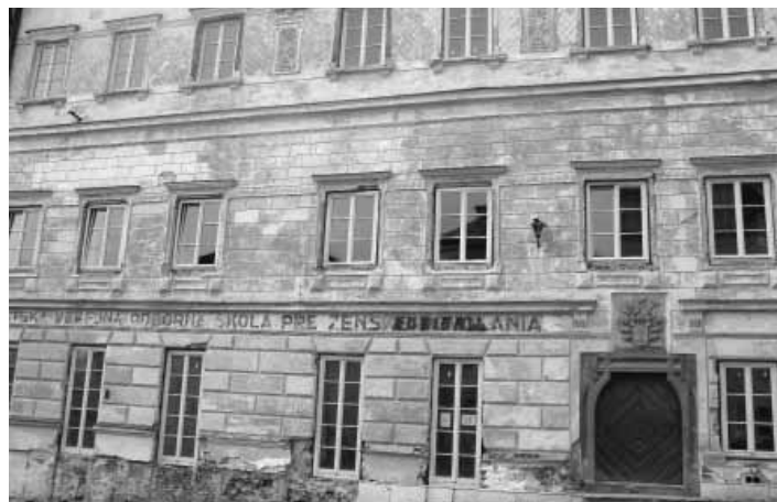
Priechod budovy Rubigallu