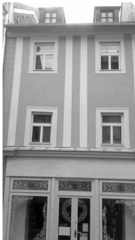
Meštiansky dom na Ul. A. Kmeťa