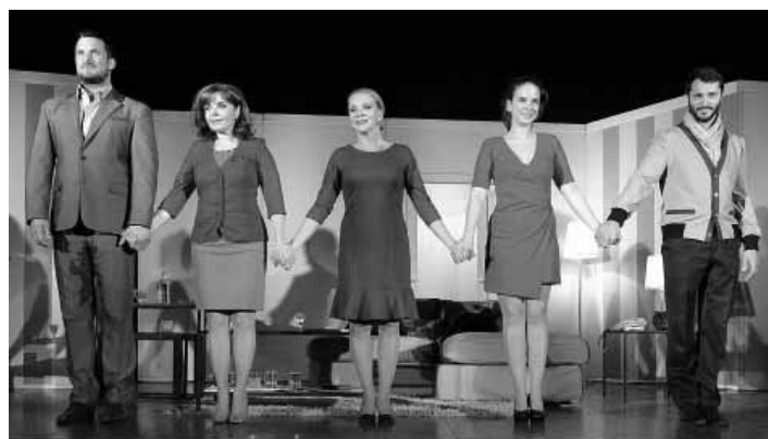
Obľúbení slovenskí herci v KC FOTO LUBO LUŽINA