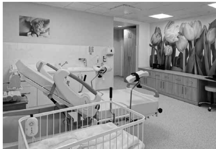
Pôrodnica novej generácie

Gynekologicko-pôrodnické oddelenie (GPO) tak stratilo multiodbovovú podporu pri riešení závažných stavov. Posledný stav bol taký, že oddelenie malo síce dobrý gynekologicko-pôrodnický tím,