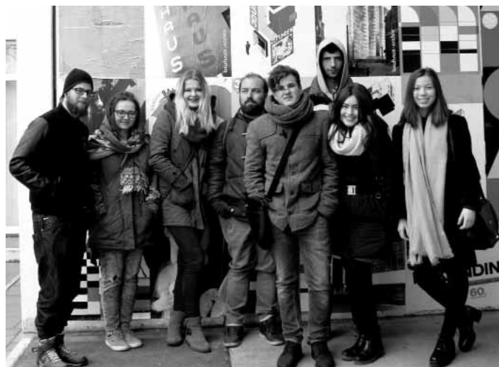
Študenti na pracovnej stáži v Berlíne

Završením projektu Erasmus+ „ Mobilita najlepší krok za európskym pracovným úspechom “ bol pre našich študentov a vyučujúcich odborných predmetov pobyt v Berlíne od 22.2. - 8.3. 2016. Po prvýkrát letcky sa sedem študentov našej školy zo študijných odborov: biotechnológia a farmakológia, propagačné výtvarníctvo, odevný dizajn a konzervátorstvo a reštaurátorstvo štukových výzdob a historických budov dopravilo do metropoly Nemeckej spolkovej republiky na zahraničnú stáž. Sprostredkovateľom praxe /stáže/ bola naša staronová partnerská projektová organizácia GEB – Gesellschaft für Europabildung GmbH v Berlíne, s ktorou sme už spolupracovali v rokoch 2007/2009. Sprostredkovala nám prax v Ernst - LietfaB Schule, Druck und Media Oberstufenzentrum, Druck -und Medientechnik /škola so zameraním na dizajn a grafiku/. Výstupným dielom našich výtvarníkov v spolupráci s poľskými stážistami bolo video prezentujúce multikultúrne spolužitie národov v Berlíne. Uvedená škola potvrdila záujem o spoluprácu s našou školou v budúcom projekte. Počas návštevy našej školy plánujeme realizovať Workshop so zamera-