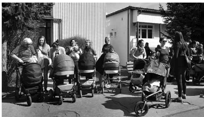
Protestujúce mamičky pred štiavnickou nemocnicou

Za aktuálne informácie poďakoval Michal Kríž