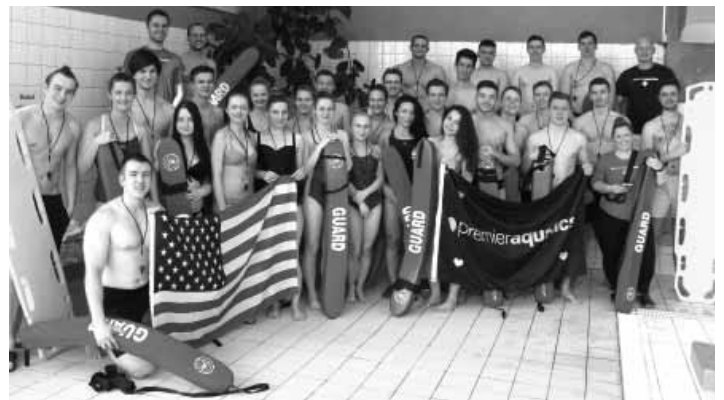
Študenti štyroch krajín na plavárni

Sme tu už 4. rok a každý rok sa do Banskej Štiavnice veľmi radi vraciame. Banská Štiavnica má viaceré výhody. Sú tu perfektní ľudia, ďalej super bazén, kde sa dá dobre vycvičiť plavčikov, lebo bazén by mal mať