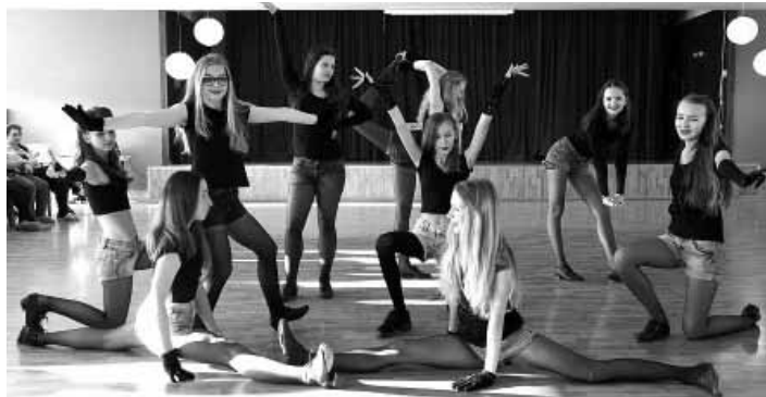
Tanečná skupina Applause