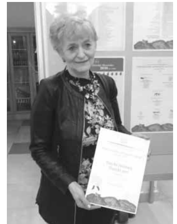
Primátorka mesta s diplomom za 1. miesto za propagačnú brožúru Banská Štiavnica – Magický svet.