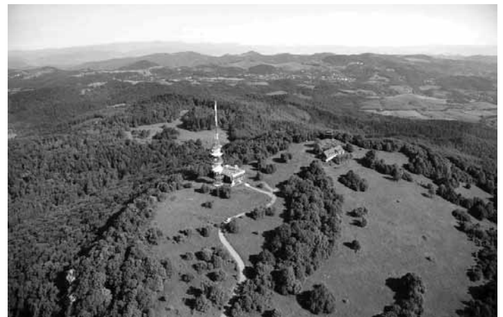
Sitno - pohľad z vrchu

Banskobystrický samosprávny kraj od roku 2016 spustil každoročný grantový program na podporu infraštruktúry cestovného ruchu. Žiadateľom môže byť obec alebo Oblastná organizácia cestovného ruchu. Zástupcovia všetkých obcí z banskoštiavnickeho okresu sa na stretnutí ešte v roku 2015 spoločne dohodli na vytvorení akéhosi zásobníka projektov, ktoré za všetky obce bude podávať OOCR Región Banská Štiavnica. Tak si jednotlivé žiadosti nebudú navzájom konkurovať. Preto tento rok sa všetky obce zhodli na spoločnom projekte opravy zdevastovaných schodov na Sitno, obnovení turistického značenia, výmene tabúl Náučného chodníka Sitno a odvodnení okolia tzv. Kanej studničky. Je potešiteľné, že obce došli