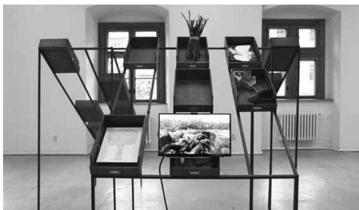
Archív daru, Galéria Jozefa Kollára

V súvislosti s aktuálnou situáciou urobíme všetko pre bezpečnosť, ochranu a pohodlie našich hostí. Aktualizovali sme aj otváracie hodiny od stredy do nedele, od 9.00 do 17.00 . Veríme, že po úspešnom spustení sezóny sa nám podarí v lete najatraktívnejšie expozície sprístupniť v modeli, ktorý naplní očakávania návštevníkov. Návštevnícky servis sme skvalitnili zabezpečením separovaného odpadu, ďalšie inovácie pripravujeme. Za rozhovor poďakoval