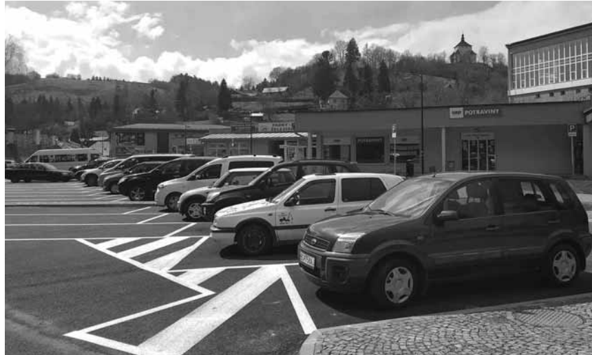
Parkovanie pod plavárňou

V zmysle platného nariadenia je parkovanie na uvedenom parkovisku od jeho rekonštrukcie spoplatnené v čase od 07:00– 18:00 hod, s tým, že prvá hodina na uvedenom parkovisku je zdarma rovnako ako na parkovisku na ulici Dolná. Na novovzniknutom parkovisku na Mládežníckej ulici platia zakúpené PPK a RPK. Rampa pustí jedno vozidlo uvedené na danej karte, načítaním EČV vozidla pri vjazde. Pri