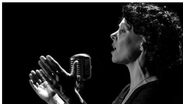
Edith Piaf