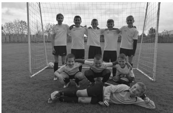
Futbalisti U11 FK Sítno Banská Štiavnica

6.kolo jarnej časti sme 2-krát odložili z dôvodu nepriazniveho počasia, ale nakoniec sme ho dohrali v utorok 21. mája. Pricestovali nás preveriť futbalisti FK Vyhne, čo je súper zo spodnej časti tabuľky, a tak sme chceli opäť