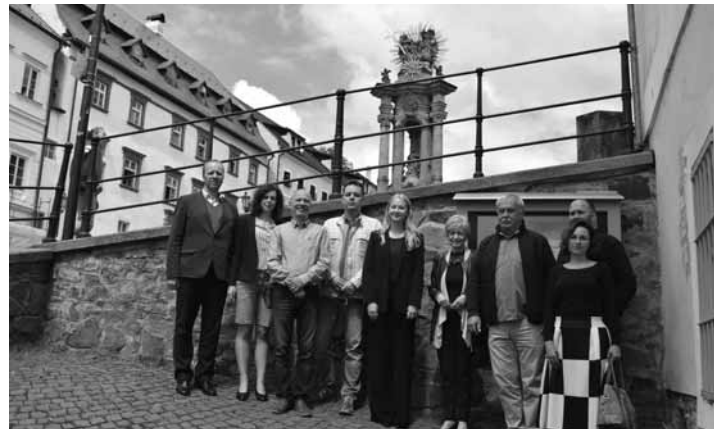
Účastníci slávnostného otvorenia infokiosku

V rámci projektu boli realizované tri aktivity. Agentúra Gashpar Creative vytvorila multimediálnu internetovú prezentáciu „Príbeh Štiavnice“, na turisticky exponovanom mieste na Nám. sv. Trojice a v Informačnom centre boli nainštalované dotykové obrazovky, ktoré Príbeh sprostredkujú verejnosti (spolu s ďalšími potrebnými informáciami) a OZ GeoTour dodalo strategický dokument, ktorý hľa-