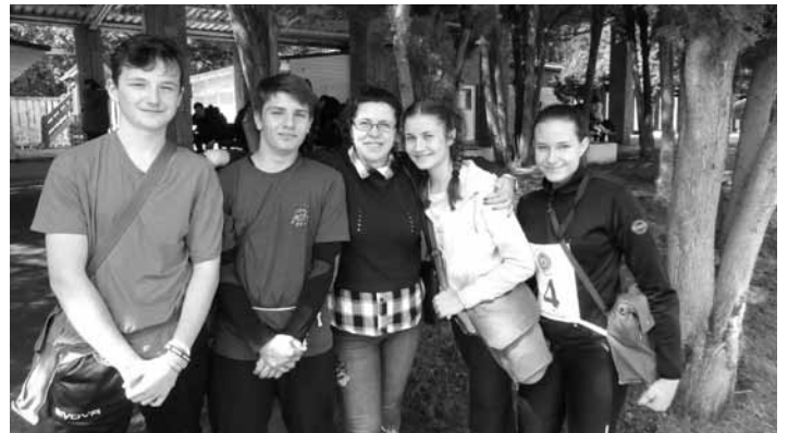
1. miesto žiakov ZŠ J. Kollára

Súťaž je určená pre žiakov základných škôl II. st., osemročných gymnázií a centrál voľného času. Za okres Ban- ská Štiavnica sa tohto podujatia zú- častnili žiaci a učelia zo ZŠ J. Horáka v B. Štiavnici, ZŠ J. Kollára v B. Štiav- nici, ZŠ s MŠ F. Coburga vo Sv. Anto- ne, ZŠ s MŠ M. Hella Št. Bane, ZŠ s MŠ v B. Belej a Katolíckej spojenej školy sv. F. Assiského v B. Štiavnici. Cieľom súťaže mladých záchranárov civilnej ochrany je pripravovať žiakov na mož- né riziká vyplývajúce najmä z pôso- benia následkov živelných pohrôm, havárií, katastrof, a teroristických útokov, overiť a precvičiť vedomosti získané učivom „Ochrana života a zdra- via“ s dôrazom na civilnú ochranu, po- hyb v prírode, poskytovanie prvej po- moci a hasenie malých požiarov. Ďalej vybudovať a upevniť návyk poskytnúť pomoc iným v prípade mimoriadnych udalostí, motivovať žiakov k záujmo- vej činnosti, ale hlavne vypestovať v žiakoch potrebné skúsenosti pri ich praktickej aplikácii v rizikových situ-