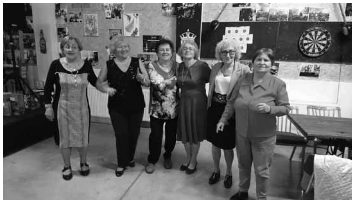
Veselé Živeniarky v Spojári

Pozvala všetkých aj na slávnostné vyhodnotenie ankety Žena mesta Banská Štiavnica, ktoré bude 28.6.2019 v hoteli Grand a tiež na slávnostný galaprogram /do nového