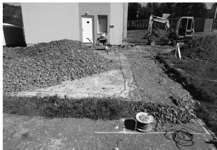
Výstavba dreveného altánku

nosti návštevníkov areálu a rovnako zatriaktivnia prostredie v okolí hracej plochy.