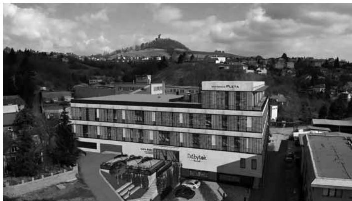
Pohľad na skelet Plety po rekonštrukcii

Na prízemí sa budú nachádzať obchodné prevádzky a garážové par-