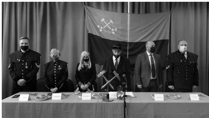
Otvorenie jubilejného šachtágu