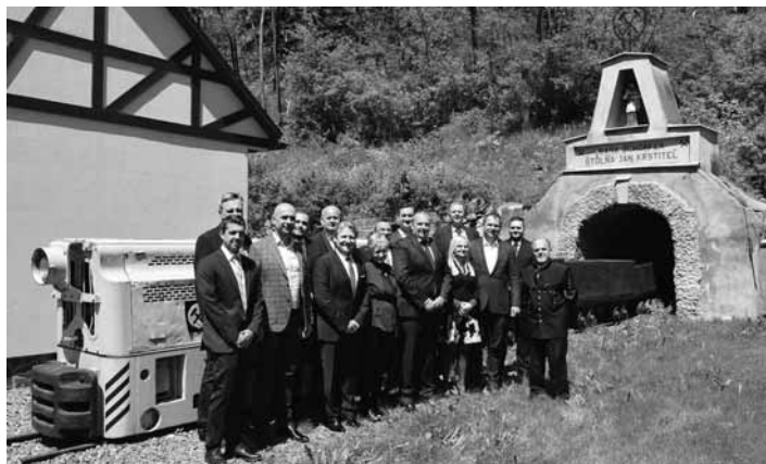
Delegácia pred Baňou Schöpfer