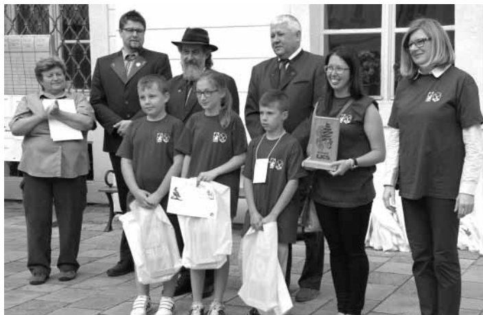
Vítané družstvo prírodovednej súťaže