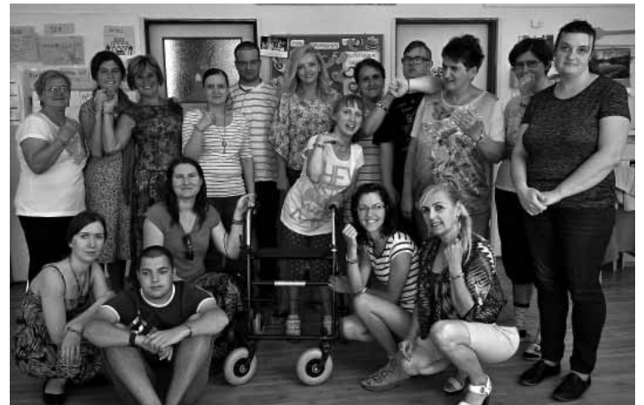
Klienti denného stacionára OZ Margarétka

Táto finančná podpora pomôže dennému stacionáru Margarétka zachovať rovnaký počet pracovných miest a tým predovšetkým udržať kvalitu poskytovaných sociálnych služieb. Finančný príspevok bude použitý na účel dofinancovania mzdy a povinných odvodov, prípadne na ďalšie vzdelávacie aktivity pre zamestnancov poskytovateľa sociálnej služby. Pre denný stacionár je dôležité zachovanie súčasného, rovnakého počtu pracovných miest, nakoľko pre klientov denného stacionára je nevyhnutný individuálny prístup a práve vďaka odbornému prístupu zamestnancov sa snažíme klientom vytvoriť takú podporu, aby klienti mohli žiť zmysluplný a čo najsamostatnejší život. Súčasným, ale i budúcim klientom denného stacionára chceme i naďalej poskytovať čo najkvalitnejšie sociálne služby, založené predovšetkým na individuálnom a odbornom prí-