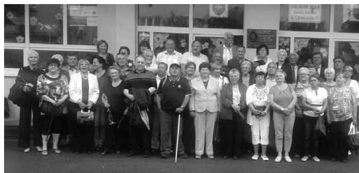
Absolventi II. základnej 9-ročnej školy z r. 1967