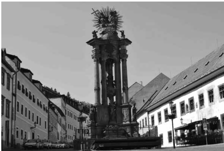
Barokové súsošie sv. Trojice je súčasťou svetového dedičstva UNESCO

CO, sa podarilo dosiahnuť taktiež mimoriadne významné úspechy. Mestská samospráva už pred rokom 1993 dosiahla u Povodia Hrona, š. p. Banská Bystrica, že tento podnik začal so systematickou rekonštrukciou hrádzí týchto unikátnych aj zo svetového hľadiska, vodohospodárskych stavieb. Táto