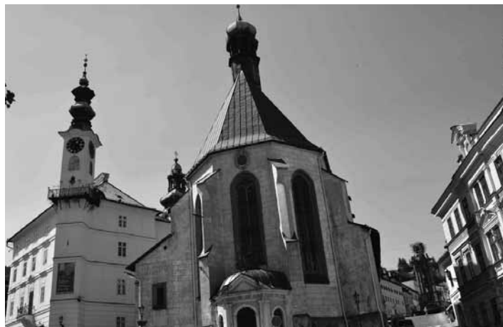
Kostol sv. Kataríny, kde bude vyvrcholenie osláv významných výročí mesta dňa 23.6.2017 o 15.00 hod.

Aj rok 1993 bol mimoriadne významným rokom pre naše mesto i celý priľahlý región. V tomto roku dosiahla Banská Štiavnica i celý náš región v doterajšej histórii najvýznamnejšie medzinárodné uznanie. 33.str.