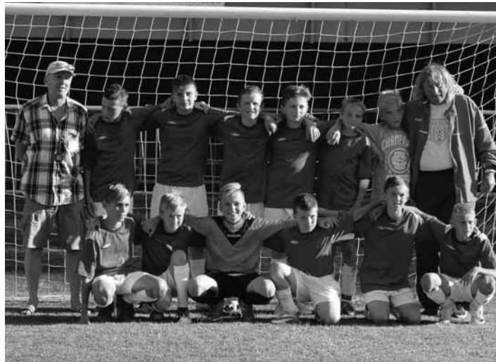
Majstri futbalovej súťaže v sezóne 2016-2017