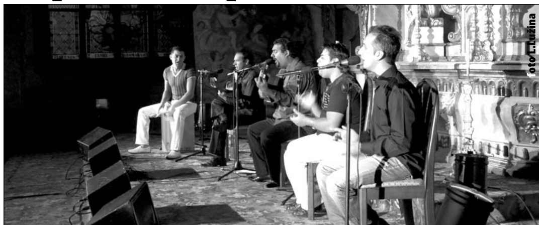
Koncert rómskych muzikantov umeleckého zoskupenia Tekameli