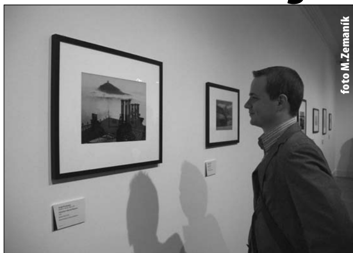
Na vernisáži aj 3 snímky banskoštiavnického fotografa Sergeja Protopopova