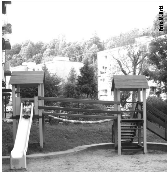
Detské ihriská na Dolnej ul. a sídlisku Drieňová opäť otvorené. Rekonštrukčné práce stáli mesto cca 100 000,-Sk.