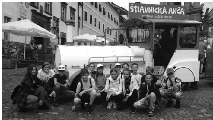
Žiaci ZŠ J. Horáka pred vláčikom

Všetci veríme, že bude určite lepšie ako ten minulý. Ten doznieval nedávno, počas letných prázdnin, a to v podobe organizovania Letnej školy. Jednou zo skupín LŠ ZŠ J. Horáka boli aj Motýlikovia, dnes už siedmici. Teoreticky aj prakticky si utvrdili nielen témy z učebníc, no spoznávali a objavovali aj históriu nášho čarokrásneho mesta. Enormnou mierou k tomu prispela aj jazda vláčikom Štiavnická Anča, vďaka ktorej sme mali všetky dominanty našej Štiavnice ako na dlani a mnohé sa dozvedeli. Počas jazdy k nám vzhľadali usmievané tváre malých či veľkých po chodníku idúcich turistov, ktorým sme opätovne úsmev a pridali