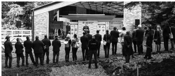
Slávnostné otvorenie arboréta v Kysihýbli