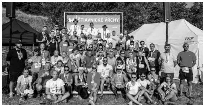
Účastníci bežeckých pretekov