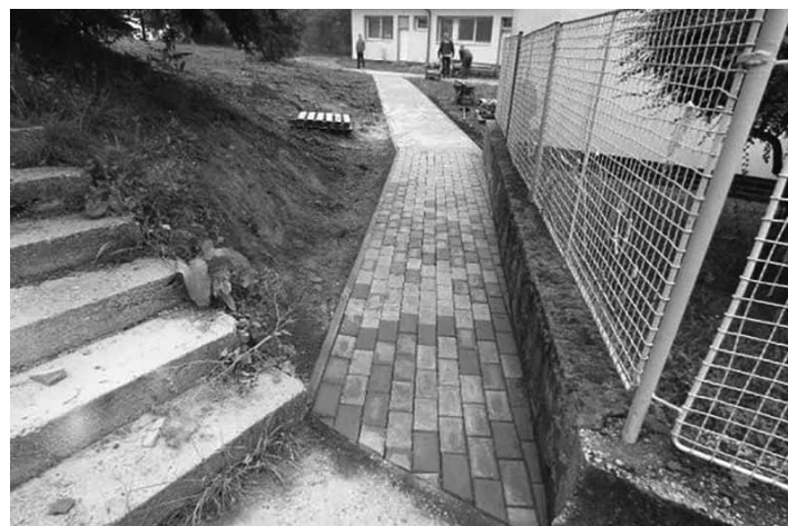
Nový chodník zo zámckovej dlažby k MŠ