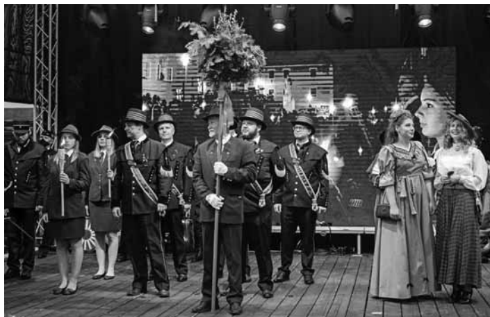
Obraz zo Salamandrového sprievodu

RM: „Tohtoročný program je rozložený do dvoch dní, a to piatku 10.9. a soboty 11.9. 2021. Je to o deň menej ako zvyčajne, napriek tomu sa návštevníci majú na čo tešiť. Z piatkových oficiálnych podujatí by som vyzdvihol slávnostné rokovanie mestského zastupiteľstva