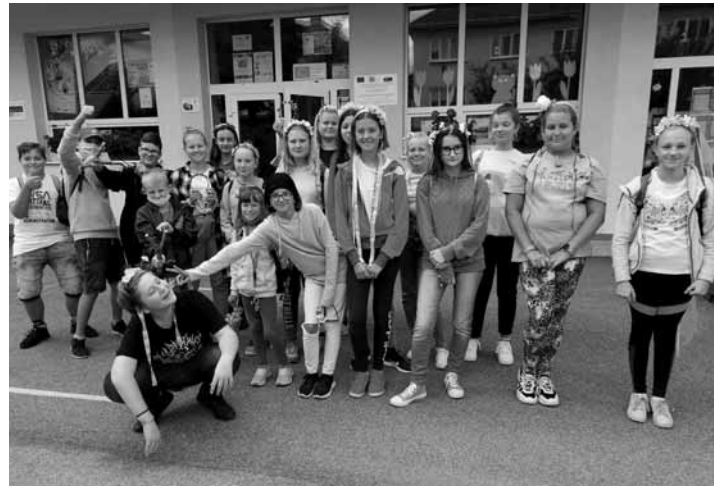
Žiaci Letnej školy

Cieľom Letnej školy MŠVVaŠ SR bola vzájomná socializácia a stieranie rozdielov medzi žiakmi v osvojenom učive počas dištančnej formy vzdelávania. Základná škola Jozefa Horáka zorganizovala Letnú školu podľa jednotlivých odporúčaní a predpripravených metodík, pričom hlavný dôraz kládla na základné princípy etickej výchovy, nakoľko je v súčasnosti potrebné medzi žiakmi nanovo vybudovať vzájomné porozumenie, rešpekt, aktivizovať ich em-