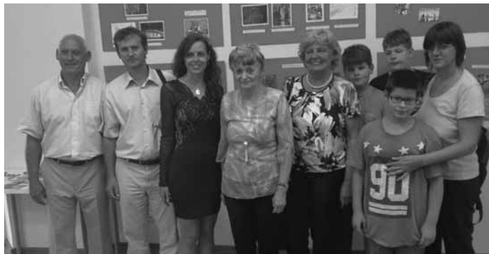
Otvorenie výstavy Svetové dedičstvo očami detí 2016 v Budapešti