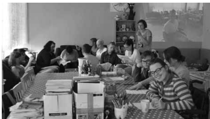
Klienti denného stacionára