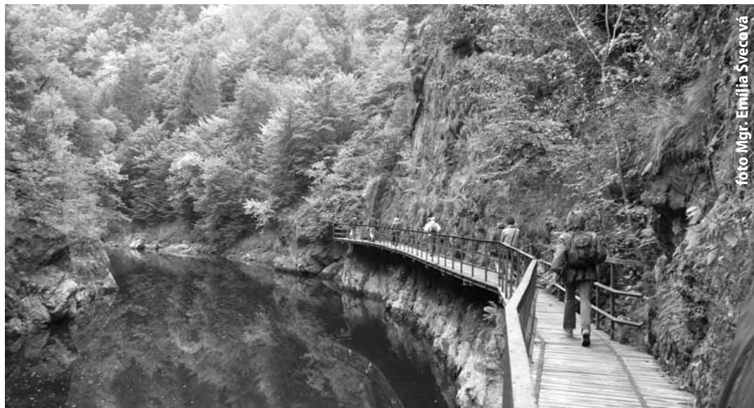
„Riegrova stezka“ – je 3,5 km dlhý náučný chodník, tiahnuci sa pozdĺž rieky Jizery, z ktorého vidieť aj pozoruhodné technické pamiatky, akou je napríklad vyše 100-ročná vodná elektrárňa.

Starostovia väčšiny obcí Banskštiavnického okresu, ale aj zástupcovia mesta, Slovenského banského múzea, SAŽP a podnikateľskej sféry navštívili najskôr Múzeum Českého raja v administratívnom srdci geoparku, v meste Turnov. Múzeum, svojou vyše 140-ročnou existenciou, patrí k najstarším regionálnym múzeám v Česku a okrem historických, archeologických a národopisných zbierok v súčasnosti dokumentuje a prezentuje predovšetkým náleziská drahých kameňov a históriu turnovského kamenárstva a šper-