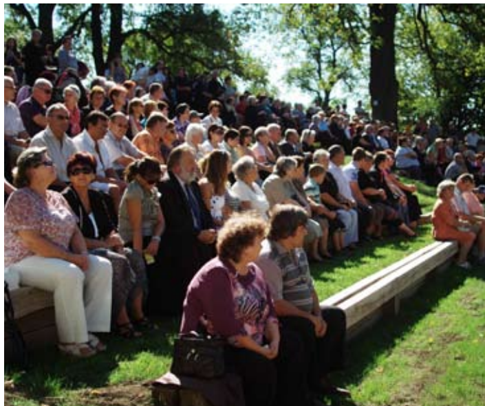
Amfiteáter na Kalvárii.

Do oltárnej niky Dolného kostola sme opäť vrátili obrovský zreštaurovaný reliéf Poslednej večere. Reštaurátori Oblastných reštaurátorských ateliérov z Bratislavy pokračujú v reštaurovaní oltárneho svätostánku. Bočné kaplnky budú prístupné pre verejnosť už toto leto, celý kostol by mal byť odovzdaný do