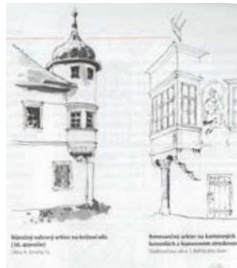
Ilustrácie Marcela Mészárosa.

Kniha sa člení na päť hlavných kapitol. V prvej kapitole Regionálne znaky historickej architektúry a urbanizmu v Banskej Štiavnici autorka približuje osadenie budov v teréne, strechy a strešné detaily, použité materiály, fasády, okná, dvere, verandy, pavlače, vikiere, arkiere a vstupné brány. Pre väčšiu názornosť uvádza ich obrázky. Skúsené oko odborníčky upriamuje pozor-