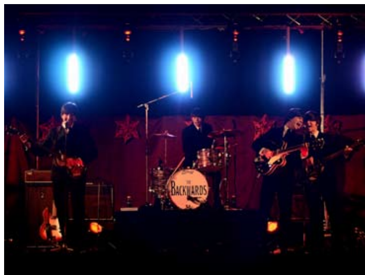
Koncert skupiny The Backwards roztancoval publikum.

To je len časť odkazov, ktoré zanechali účastníci koncertu Beatles Vianoce: The Backwards na internetovej stránke tejto skupiny. Záverečný koncert roka v réžii Mest-