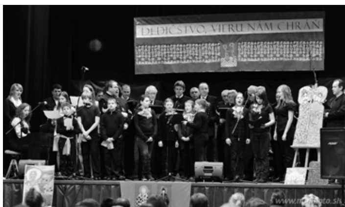
Záverečné číslo programu