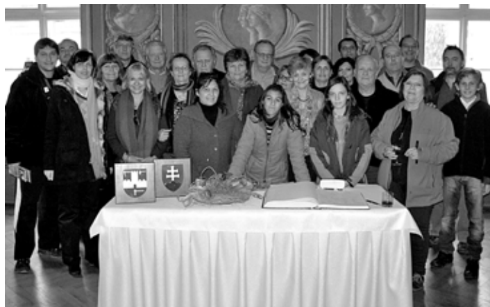
Privítanie vzácných hostí z Argentíny

Slováci žijú v 40 krajinách sveta a viac ako dva milióny z nich sa hlásia k slovenskému pôvodu. Medzi tých, čo sa cítia byť Slovákmi, patria aj krajanovia z Argentíny. Na rozdiel od iných slovenských komunit, sú Slováci v Argentíne pozoruhodní aj tým, že sa tu usadila celá plejáda významných osobností slovenského kultúrneho a politického života. Napríklad Martin Kukučín,