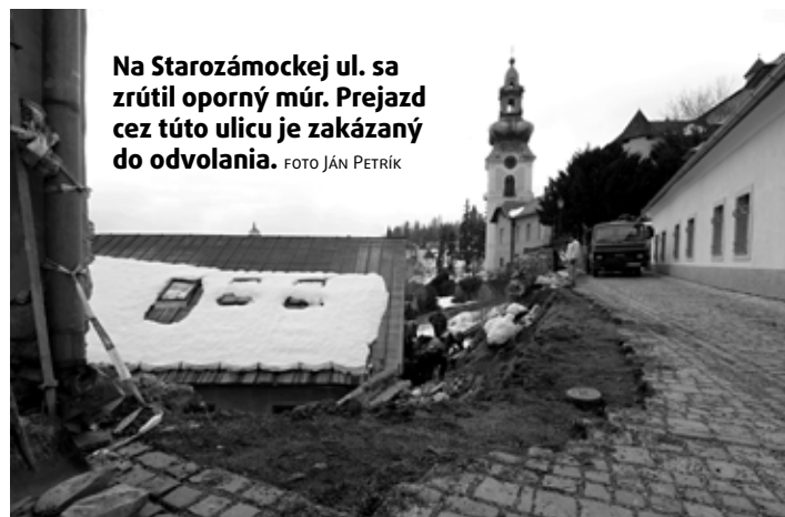
Na Starozámockej ul. sa zrútil oporný múr. Prejazd cez túto ulicu je zakázaný do odvolania.