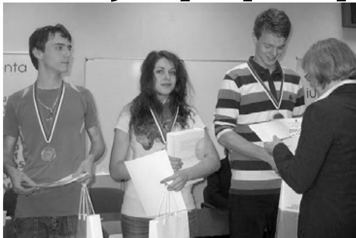
Úspešní reprezentanti SPŠ S. Mikovíniho