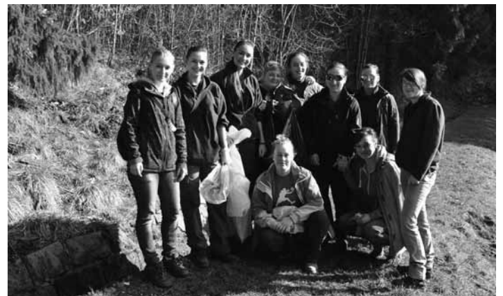
Študenti SOŠL