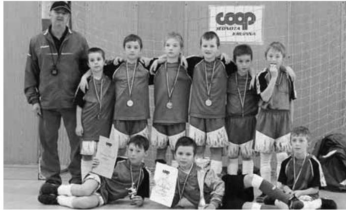
Futbalová prípravka s trénerom