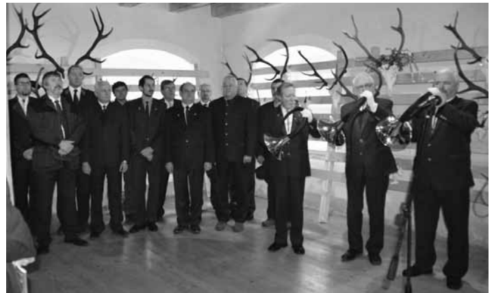
Otvorenie prehliadky poľovníckych trofejí