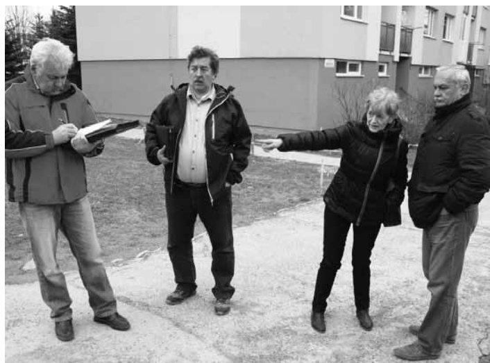
Riešenie problematiky na sídlisku Drieňová