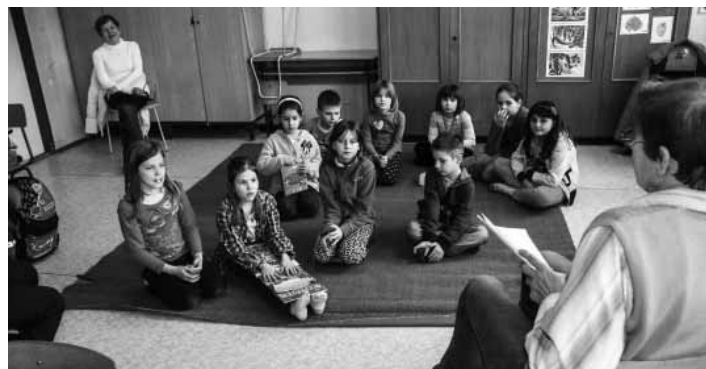
Družinári na zaujímavej besede