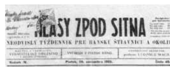
Hlasy zpod Sitna (1922-1928)