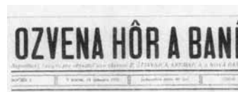
Ozvena hôr a baní (1932)

Po ročnej prestávke vo vychádzaní periodika v meste sa objavuje nový týždenník Ozvena hôr a baní s podtitulom Nepolitický časopis pre obyvateľov okresu Banská Štiavnica, Kremnica, Nová Baňa. Prvé číslo vyšlo 8. januára 1932. V Ozvene hôr a baní sa objavujú dlhšie materiály, chýba však výraznejšie zastúpenie spravodajstva. Redakcia mala neustále problémy s počtom svojich dopisovateľov i odberom novín. 17. júna 1932 prestali vychádzať. Dohromady vyšlo 24 čísiel.