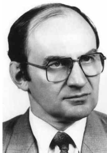
Prvý šéfredaktor ŠN

Neromysľal som ani chvíľku, prijal som túto ponuku a prvé číslo vyšlo už o dva mesiace. Šéfredaktor som robil popri funkcii riaditeľa Štátneho ústredného banského archívu až do roku 1998 a potom ešte v roku 2003 a 2006, v rokoch 1999 – 2005 som bol predsedom redakčnej rady a potom až do roku 2009 členom redakčnej rady týchto novín, nehovoriac už o nespočetnom množstve príspevkov, ktoré som od roku 1990 dodnes napísal. Dovoľm si preto povedať, že tieto moje reminiscencie majú tú najautentickejšiu a najvierohodnejšiu podobu.