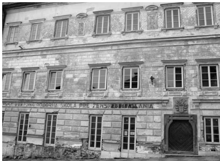
Rubigallovský dom, kde bola prvá redakcia ŠN