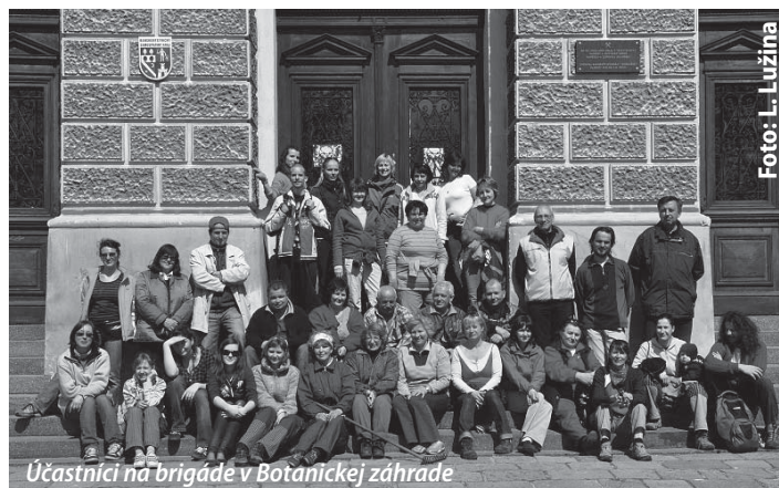
Účastníci na brigáde v Botanickej záhrade

Bolo úžasne pozorovať, ako ľudia pri hrabaní, zametaní a nakladaní dávali pozor, aby nezničili to, čo sa už derie na svetlo, čo raší, prediera sa, aby malo šancu ďalej žiť...kohútiky, úponky brečtanu, zakrpatené fialky, no predovšetkým mladé sadenice vzácných drevín, na ktoré nás upozornila prítomná pani in-