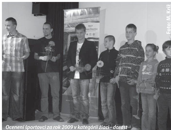
Ocenení športovci za rok 2009 v kategórii žiaci - dorast