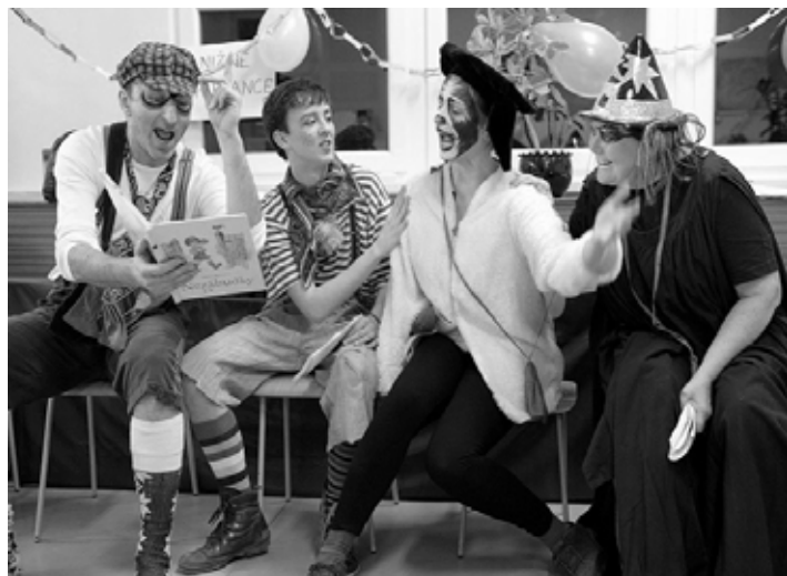
Zábavné rozprávkové postavičky