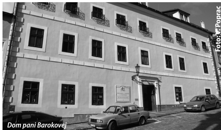
Dom pani Barokovej

Tak veru, krásne sa to spomienky na Námestie sv. Trojice. Život na námestí začínal v stredu, piatok a v sobotu približne o tretej hodine nad ránom príchodom trhovníkov, ktorí rešpektovali nočný pokoj a šetrne rozkladali svoj tovar. Z oblokov na druhom poschodí mali prehľad o sortimente ponúkaného tovaru, počnúc známou pukanskou cibulkou a zeleninou po voňavú pečenú husacinu, živé prasiatka... Aj Bulhari od Novej Bane začali vykladat čerstvú zeleninu. O čo sú ochudob-