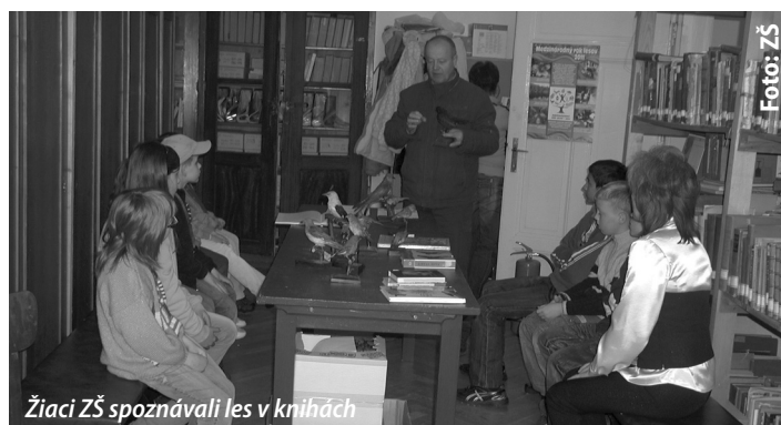
Žiaci ZŠ spoznávali les v knihách

Nadviazali tak na už tradičnú marcovú akciu "Po písničkách", ktorú si zorganizovali po štvrtýkrát a zároveň začali aktívne pracovať