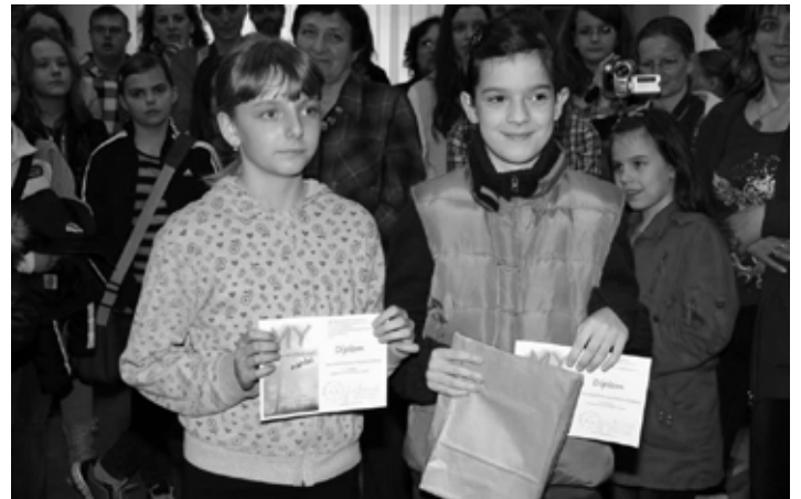
Ocenené autorky