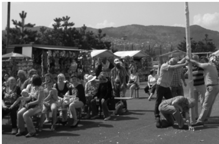
Prvomájové oslavy na sídlisku Drieňová

Vie niekto, že 1.5.2013 je sviatok práce? A prečo je hlavne sviatkom? Za socializmu sa to oslavovalo. Nepracovalo sa, pilo a zabávalo sa (teda okrem roľníkov, pokiaľ v ten deň nepršalo a ľudí v nepretržitých prevádzkach). Všade navôkol sa organizovali kultúrne poduja-