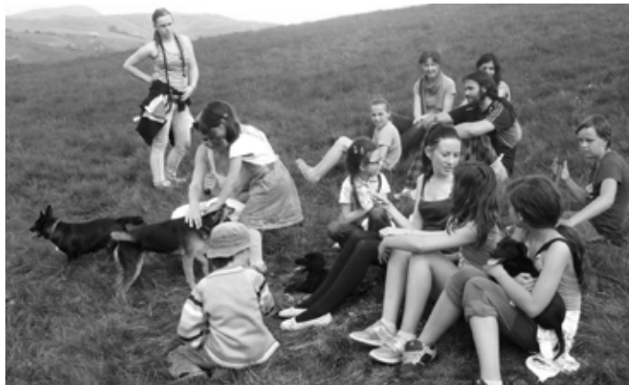
Venčenie psíkov

Psíci behali navoľno, dokonca boli na ich prvej prechádzke aj naši najmenší obyvatelia útulku, šteniatka Pongo, Penny a Peggy. Deti aj pani