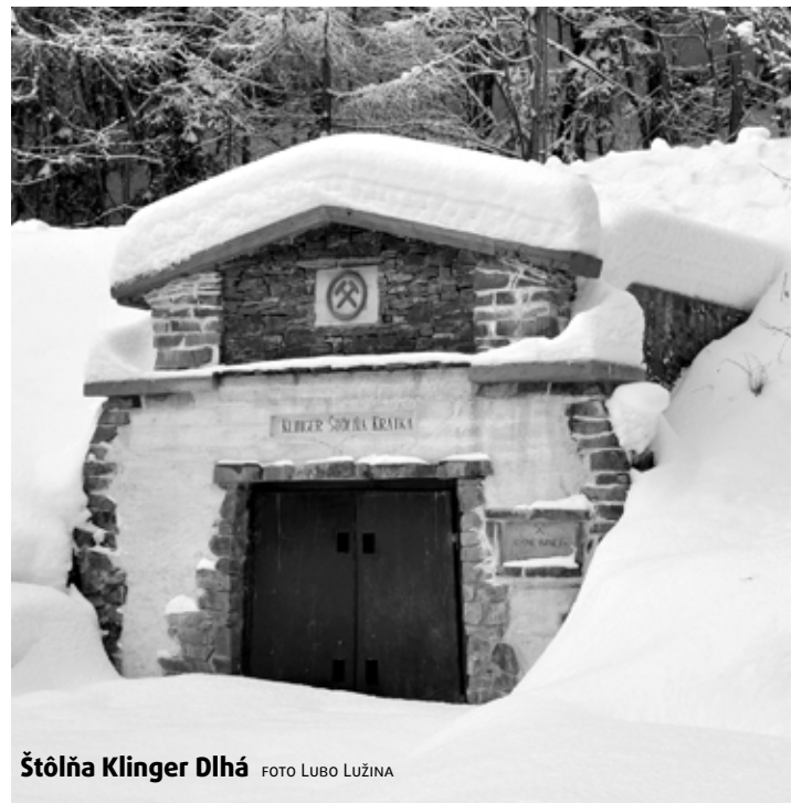
Štôlna Klinger Dlhá