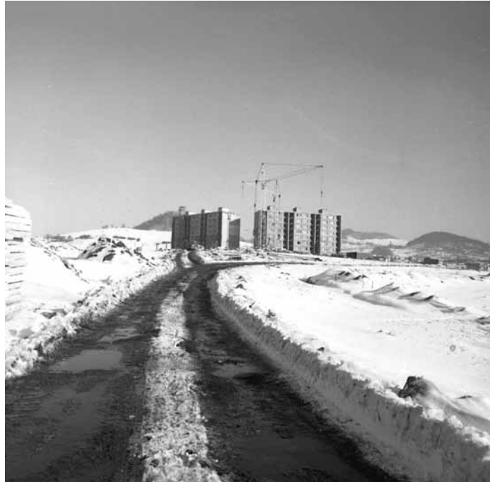
Drieňová vo výstavbe, zdroj: archív SBM

Život na sídlisku sa podobá včeliemu úľu. Každý v ňom má svoje miesto a zmysel. Jedna obrovská komunita, v ktorej sú všetci anonymní, ale spolu vytvárajú dav s osobitou charizmou. „V rámci Projektu Mesta kultúry 2019 by sme sa radi dostali do srdca tohto davu a spoločne so všetkými obyvateľmi vytvorili možno pomínuteľné, ale nezabudnuteľné chvíle“. Súčasné umenie zažijú Drieňovčania v podobe vizuálnych umeleckých zásahov do verejného priestoru, divadelných a tanečných performance a komunitných