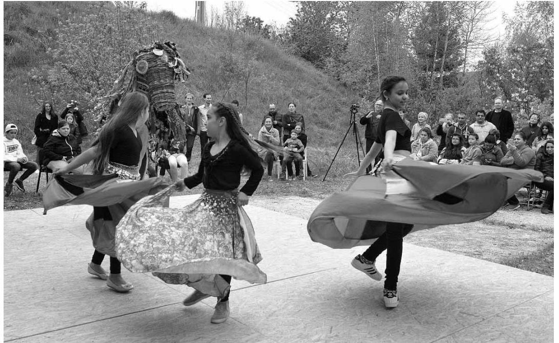
Momentka z predstavenia a atmosféra pred KC Obývačka, Povrazník

Naše predstavenia (alebo workshopy) inšpirované rómskou kultúrou boli vždy od začiatku vytvárané spoločne s rómskymi