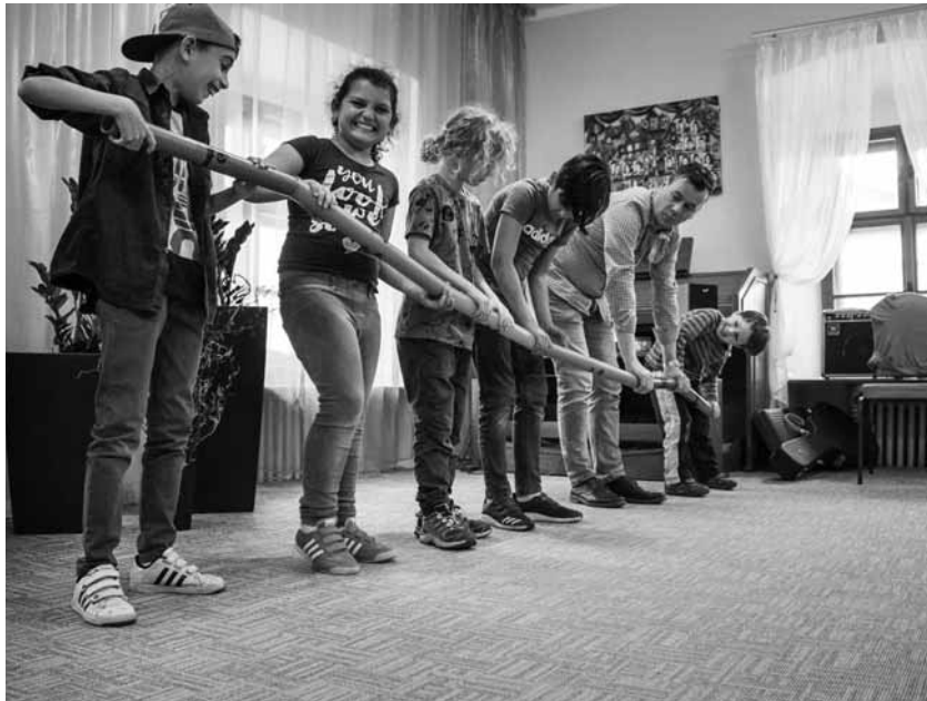
Zvuková improvizácia bez hraníc, z workshopu

V našom oficiálnom hudobnom vzdelávaní sme zvyknutí, že hráme podľa nôt, že hráme to, čo sa má hrať, a týmto ostáva málo priestoru pre vlastnú tvorivosť a vlastnú kompozíciu. Dnes tu prišli skvelé deti aj s rodičmi, lebo je to spoločné muzicírovanie. Spoločne sme vytvárali rôzne hudobné farebné plochy a improvizácie. Jednoducho sme sa hrali s hudbou. Pre deti je to hra, ale pre nás je to presná koncepcia, ktorá má priviesť deti k tomu, aby zasli nad zvukom, aby zistili, že