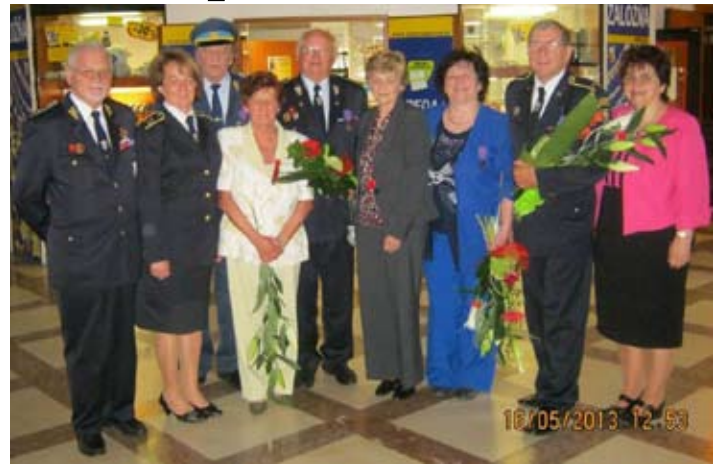
Vyznamenaní členovia DPO SR

Slávnostné odovzdanie najvyššieho titulu „Zaslúžilý člen DPO SR“ ukončili svojimi príhovormi prezident Hasičského a záchranného