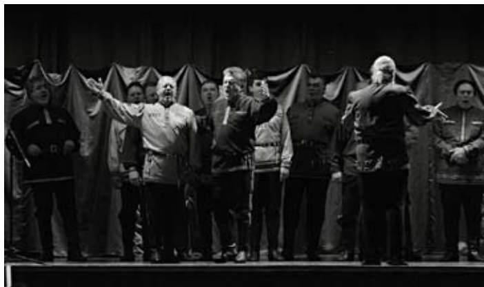
Donskí kozáci v akcii

Na koncerte v Banskej Štiavnici sme smeli obdivovať trinásť veľkých speváckych osobností, trinásť jedinečných hlasov v dvadsiatich piatich piesňach, a pritom jedna krajšia ako druhá. V úvodnej časti zazneli pravoslávne liturgické spevy, pri ktorých sa zo dna najhlbšej pokory dvíhalo mohutné vlnobitie emócií. Boh nad nami je len jeden, nech by sme sa mu prihovárali akoukoľvek rečou - na kolenách, pod kri-