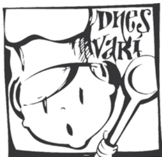
Klub dôchodcov Štefultov