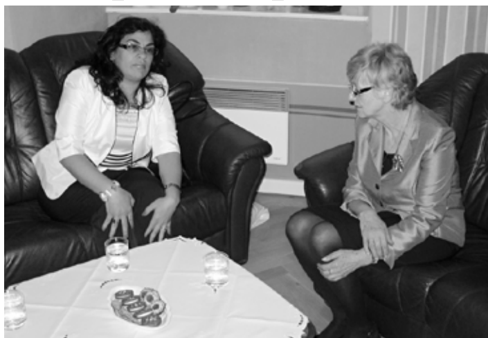
Kubánska veľvyslankyňa na radnici