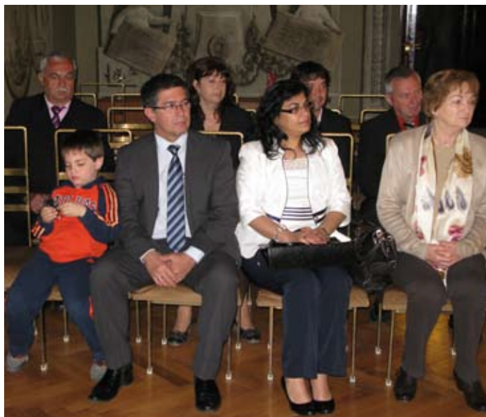
Delegácia v Obradnej miestnosti