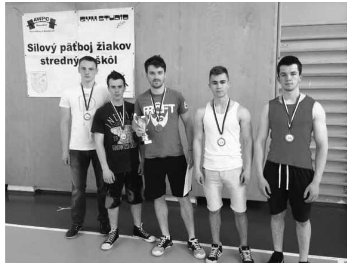
Úspešní študenti SPŠ S. Mikovíniho