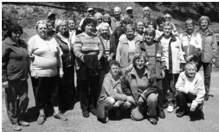
Členovia SZTP v Bankej Štiavnici

34 nadšencov prešlo územím Čerenej studne, pokračovalo lokalitami Zadných Rosniarok a Hornohodrušského banského jarku, až postupne došli do Veterného sedla, miesta hornej nástupnej stanice lyžiarskeho vleku nad Hornou Rovňou. Tu nasledovala prestávka, účastníci sa mohli kochať nádherou hodrušskej aj štiavnickej doliny a obdivovať rôzne odtiene zelenej farby, ktoré dokáže vykúzliti len sama príroda. Po načerpaní nových síl sa turisti vydali na poslednú časť pre-