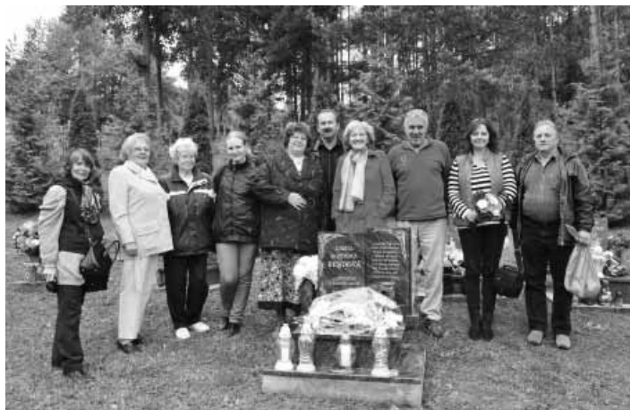
Autorský klub pri hrobe Kristy Bendovej