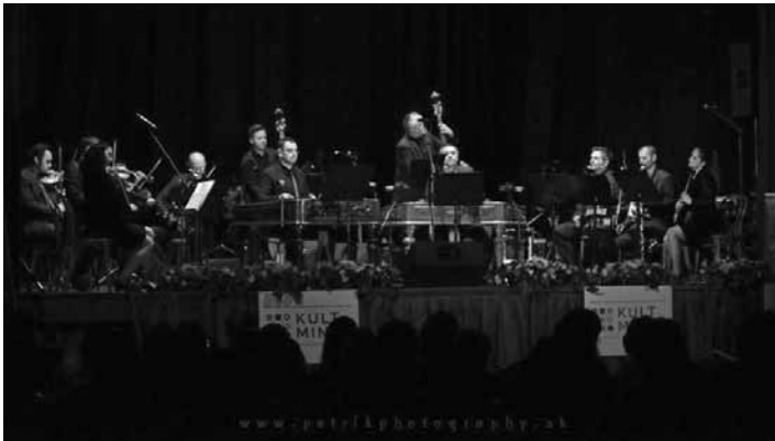
SĽUK & Pacora Trio, Kultúrne centrum