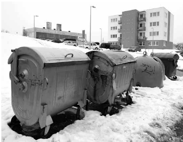
Drieňová z uhla pohľadu