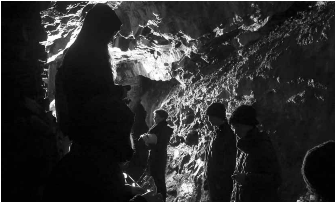
Atmosféra v štôlne Bartolomej počas performance