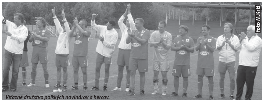
Vítané družstvo poľských novinárov a hercov.

Stretnutie za premenlivého počasia malo dobrú úroveň a priateľskú