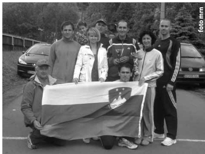
Bežci z obidvoch spriateľných miest s vlajkou Slovinska.