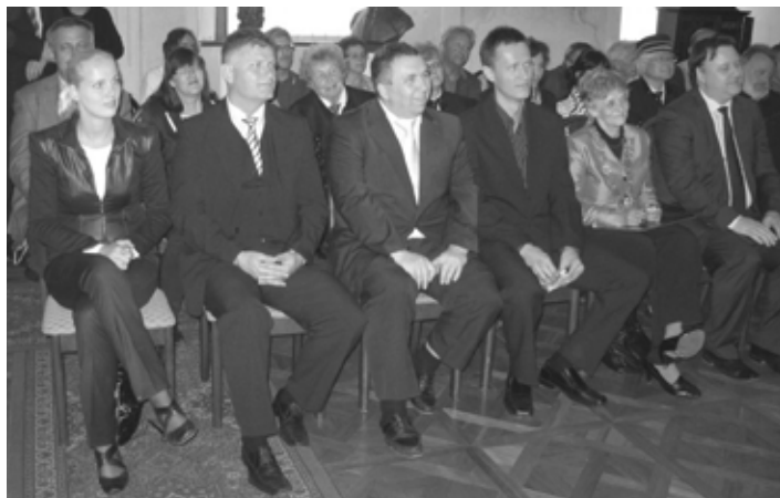
Vzácní hostia v Kammerhofe