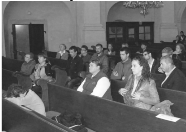
Noc kostolov v Evanjelickom chráme