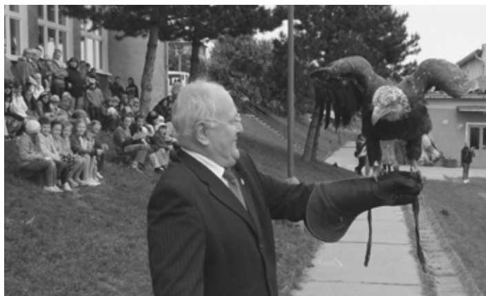
Minister školstva si vyskúšal prilet dravca na ruku.