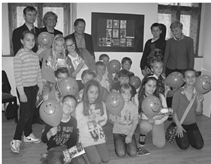
Otvorenie výstavy za účasti vzácných hostí