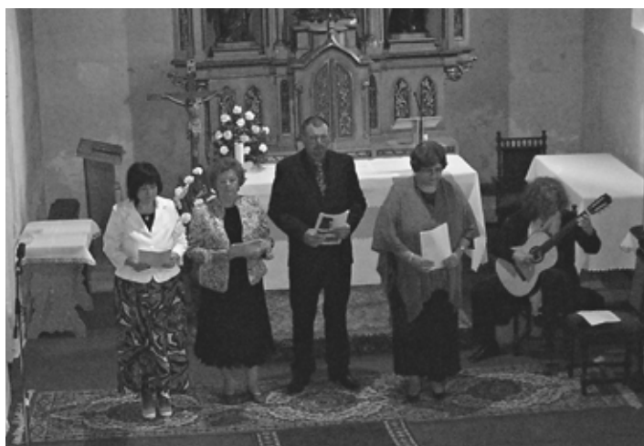
Účastníci dramatického pásma "Odkazy"

V nedeľu 26.mája si návštevníci rímsko – katolíckeho kostola svätého Michala toto plynutie času / od príchodu vierozvestcov Cyrila a Metoda na naše územie/ pripomenuli prostredníctvom literárno – dramatického pásma „Odkazy“. Pre obyvateľov obce Jastrabá ho pripravili zamestnanci BBSK – Pohronského osvetového strediska v Žiari nad Hronom, v spolupráci s obecným a farským úradom tejto malebnej obce. Pásmo básní, historických textov a hudby vytvorili dôstojnú spomienku na predkov, ktorí sa zapísali do európskych dejín písomnou kultúrou a etickými normami kresťanstva. Preloženie prvých liturgických textov do staroslovienčiny položili základ slovanskej písomnosti a vzdelanosti. Odkazy oboch vierozvestcov štyria recitátori sprítomňovali prednesom pasáží z ich diel a podporili tak