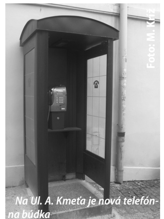
Na Ul. A. Kmeťa je nová telefónna búdka