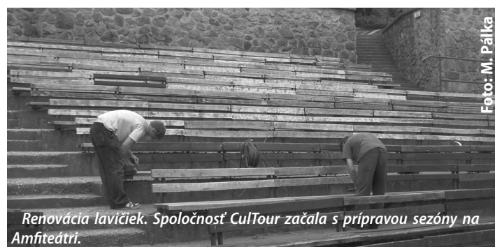
Renovácia lavičiek. Spoločnosť CulTour začala s prípravou sezóny na Amfiteátri.