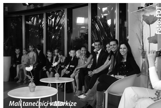
Mall tanečníci v Markíze