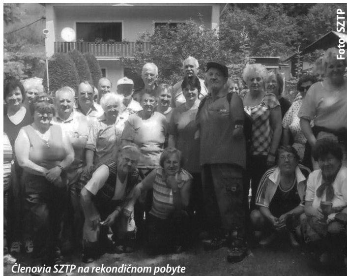
Členovia SZTP na rekondičnom pobyte

točnil rekondičný zájazd 80 členov SZTP do Podhájskej. Celý zájazd, niekoľkohodinový pobyt v slanej vode i počasie sa nadmieru vydarilo, a tak nám zostali spomienky