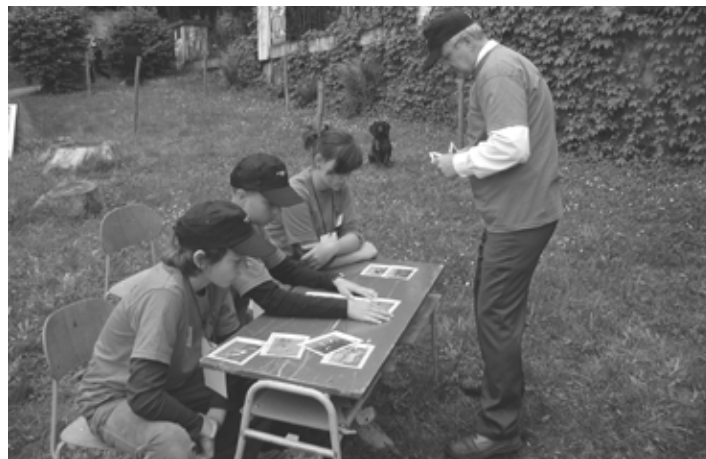
Účastníci súťaže

V areáli svätoantonského kaštieľa sa 6. júna 2013 konal už tretí ročník prírodovednej súťaže „Čo šepká les“. S myšlienkou realizovať takúto zaujímavú súťaž prišli priatelia z Obvodnej poľovníckej komory Žiar nad Hronom pred tromi rokmi a okrem OPK Žiar nad Hronom je jej hlavným organizátorom taktiež Odštepny závod Lesov SR v Žarnovici. Spoluorganizátormi sú Stredná odborná lesnícka škola v Banskej Štiavnici, Regionálna organizácia Slovenského poľovníckeho zväzu v Žiari nad Hronom, Mestské lesy Banská Štiavnica, Poľovnícka spoločnosť Šarvitz Voznica, Obvodný lesný úrad Žarnovica a Múzeum vo Svätom Antone. V treťom ročníku súťažilo 14 trojčlenných družstiev 4.-6. ročníkov vybraných základných škôl z okresov Banská Štiavnica, Žarnovica a Žiar nad Hronom. Súťažilo sa v nasledovných disciplínach: Poznávanie zveri, vtákov a plazov, Poznávanie stôp zveri, Poznávanie hlasov zveri, Poznávanie stromov, listov a plodov, Poznávanie pohorí regiónu, Poľovnícka kynológia, Strelba na laserovej strelnici, Zhotovovanie krmidla pre vtáčiky, Sadenie stromčekov na čas a samozrejme na kvalitu. Každý ročník je pripravená i tvorivá disciplína. Predminulý rok deti tvorili plagát o ochrane prírody, minulý rok poviedky o prírode a tohto roku priniesli fotografie príro-