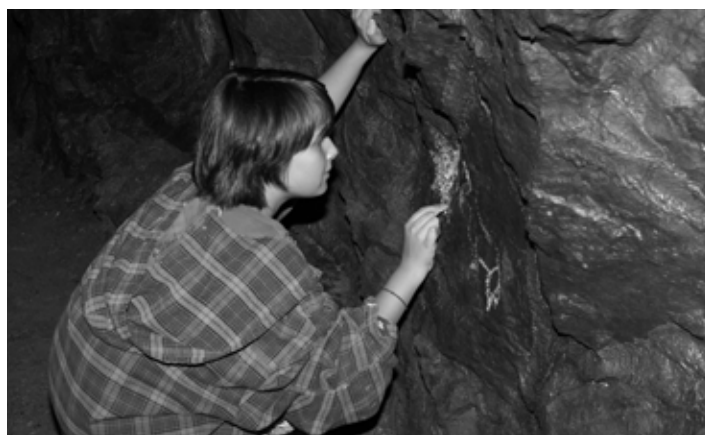
Maľovanie v štôlni Michal