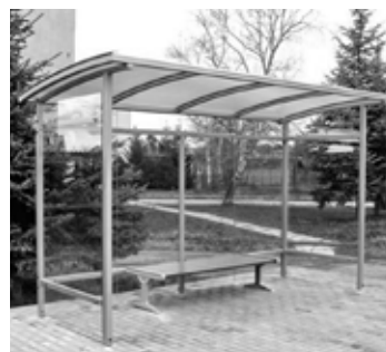
Ilustračné foto ZDROJ: INTERNET

ná lavičkou (2 ks väčších aut. zastávok budú vybavené po 2 ks lavičiek a 2 ks košov), smetným košom, reklamným panelom a panelom na cestovný poriadok. Na realizáciu nám bol poskytnutý nenávratný finančný príspevok zo strany Pôdohospodárskej platobnej agentúry v maximálnej výške 19 196,36 EUR. Realizácia rekonštrukcie bude prebiehať postupne a je naplánovaná na letné mesiace. Ukončenie celkovej realizácie bude najneskôr do septembra 2013.