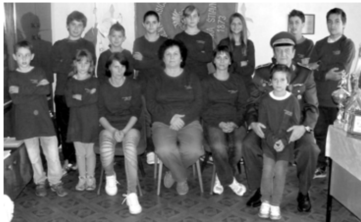
Družstvo Plameniakov