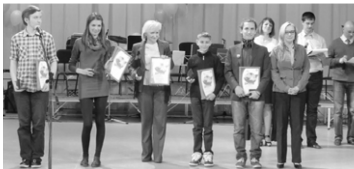
Účastníci Medzinárodnej konferencie UNESCO

Gymnázium A. Kmeťa sa mohlo zúčastniť konferencie na základe projektov, ktoré úspešne uskutočnilo v rámci UNESCO, iniciatívy v minulých rokoch a na základe najúspešnejšieho a víťazného projektu, ktorý bol vypísaný UNESCO-m Slovensko pre UNESCO školy. Konferencie sa zúčastnilo mimo slovenského zástupcu 21 partnerských škôl z Ruska, Poľska, Slovinska, Fínska, Bulharska, Čiernej Hory a Ukrajiny. Viac ako 100 žiakov a 21 učiteľov sa denne zapájalo do perfektne pripravených akcií a workshopov organizovaných ruskou stranou a jej odborníkmi (zástupcovia rôznych ochranných organizácií a UNESCO). So zreteľom na ekologické a environmentálne otázky boli žiaci rozdelení do štyroch pracov-