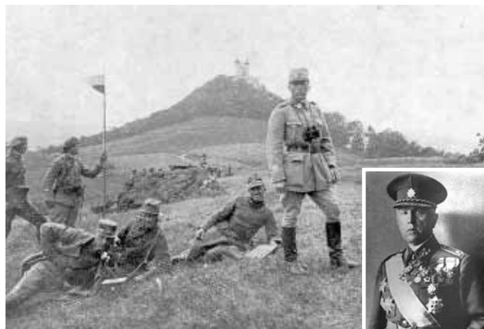
Francúzsky plukovník českého pôvodu Josef Šnejdárka (stojaci vpravo) ako veliteľ 2. divízie Československej armády v júni 1919 pri bojoch na Slovensku. Fotograf ho zachytil pod vrchom Kalvária v Banskej Štiavnici.

Po skončení I. sv. vojny, 20 marca 1919, Najvyššia rada dohodových mocností oznámila Maďarom vytýčenie druhej demarkačnej línie medzi územím Maďarska a nástupníckymi štátmi. To bol definitívny koniec koncepcie uhorskej integrity. Maďarský prezident Károlyi abdikoval, moc v štáte odovzdal socialistom a bolševikom (Béla Kún). Následne 21. marca bola vyhlásená Maďarská republika rád, odmietla demarkačnú čiaru, čo malo za následok rumunskú (16.apríla) a československú (27.apríla) intervenciu v Maďarsku. Maďarské červené gardy však po protiútoke, 29.mája, prekročili hranice Slovenska a začali ho rýchlo obsadzovať dvomi smermi, cez Košice na Prešov a cez Lučenec na Zvolen a Žilinu. Na strednom Slovensku obsadili Lučenec, Krupinu, Levice, Banskú Štiavnicu a Zvolen. Mali početnú prevahu. Situácia bola dramatická, preto sa 1.júna stal veliteľom čs. vojsk na Slovensku francúzsky generál Pellé, ktorý okamžite vymenoval za veliteľa demoralizovanej 2. divízie plukovníka Josefa Šnejdárka. Ten skonsolidoval zdecimovaných vojakov, zastavil Maďarov taktikou rýchlych protiútokov a už 10. júna začal ofenzívu v smere na Banskú Štiavnicu, cez Sklené Teplice a Tepľú. Tam došlo k zrážke s nepriateľom, ktorý utiekol takmer bez boja do Štiavnice. Čs. jednotky tvorené najmä skúsenými čs.legionármi francúzskej a talianskej armády zaútočili na mesto zo severu a zo západu, a v priebehu hodiny sa ho aj zmocnili. Potom vojsko vedené plk. Šnejdárkom postupovalo na Hr. Breznicu, 13. júna oslobodilo Baďín,