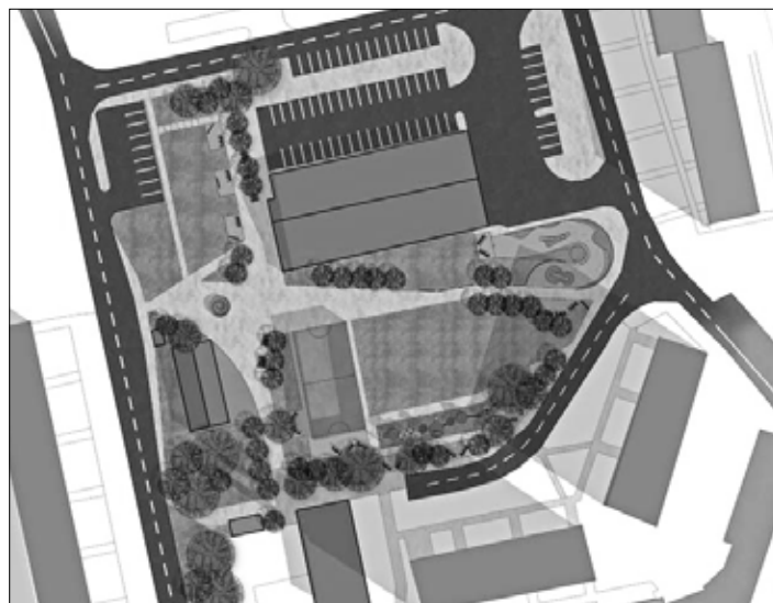
Návrh riešenia Mestského parku na Drieňovej

Dňa 07.06.2013 bol podpísaný Dodatok č. 1 k Zmluve o dielo s LEVSTAV – LEVICE, s.r.o. na sumu 37 406,304 EUR (s DPH), na realizáciu I. etapy projektu.