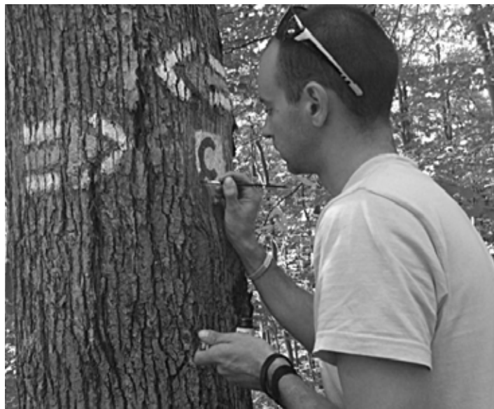
Značenie cykloturistických trás

Novinkou v tomto roku je Regionálna zlavová karta, ktorú spustil od 1. júna RBŠ. Uvedenie bolo podporené kampaňou v médiách, ktorá mala vynikajúci ohlas. Článok o štiavnickom regióne na internete prečítalo iba v prvom týždni kampane viac ako 33 000 ľudí, do anket sa aj vďaka cenám, ktoré poskytli ubytovatelia regiónu, zapojilo 1890 ľudí. Kampaň v mediálnej hodnote 43 000 eur získala RBŠ zdarma. Regionálna karta sa pomaly rozbieha aj v praxi, spolupráca zúčastnených subjektov tak prináša prvé plody. Poslucháči FUN rádia možno tiež zaregistrovali inú kampaň podporujúcu imidž Štiavnice dňa 8.6.2013. Pred spustením sú vyhnianske a belianske cyklotrasy, dovedna viac ako 90 km nových trás s tabulami a smerovkami. Vyhnianske trasy v úzkej spolupráci