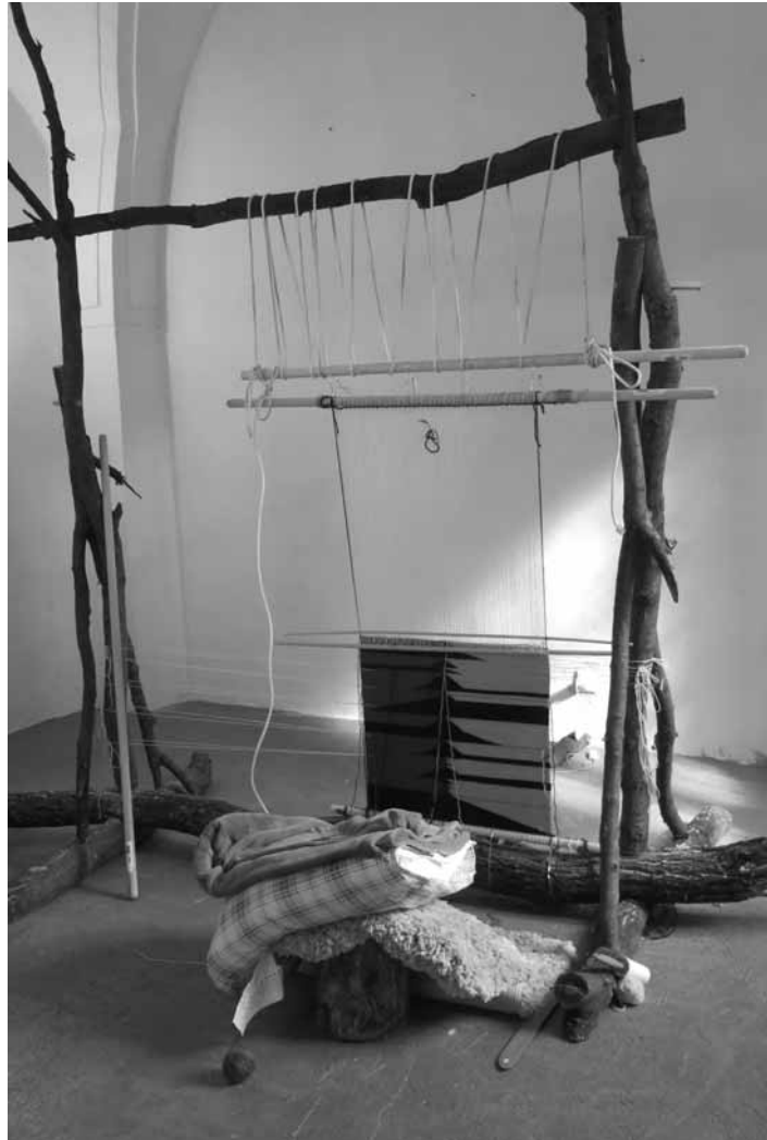
Tkáčsky rám vyrobený špeciálne pre rezidentku

Počas pobytu sa Marilou venuje projektu, ktorý prepája tkanie, ako jednu z najstarších ľudských technológií, s najnovšou, počítačovou technológiou. Obe fungujú na tom istom princípe – na binárnom kóde. Vytkávaný vzor vzniká prelínaním osnovy a útku, čo je v princípe binárnym kódovaním – priadza sa môže nachádzať iba pred alebo za osnovou. Toto robí z tkáčskeho rámu najstarší digitálny stroj. Na základe tejto spoločnej črty vzniká projekt, v ktorom Marilou tká tapisériu, ktorá vychádza z algoritmov, ktoré poháňajú finančnú burzu. Viac ako 70% svetového trhu je kontrolovaného superrýchlymi algoritmi, ktoré spolu neprestajne interagujú, kupujú a predávajú naše bohatstvo. Vzájomnou reakciou sa algoritmy stávajú komplexnejšími a zložitejšími, ľudstvo im postupne prestáva rozumieť a stráca schopnosť ich čítať. V roku 2010 sa stala zvláštna vec: algoritmy sa začali správať nevypočítateľne a vymazali 9% objemu všetkých peňazí, s ktorými burza obchodovala. Táto udalosť vošla do dejín ako Flash Crash. Algoritmy, ktoré boli zodpovedné za Flash Crash nikto nenaprogramoval, vznikli samé od seba, nekontrolovanou mutáciou. Tieto zdivočelé algoritmy prichádzajú z autonómneho sveta, ktorý vzniká za hranicou ľudskej kontroly. Vzory na starobyľných tkaninách zobrazovali väčšinou veci neviditeľné, spirituálne a posvätné, záznamy zo svetov mimo ľudskej dimenzie a vedomia. Podobne aj projekt