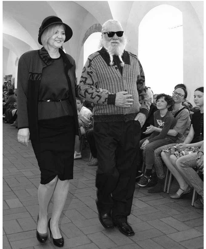
Z módnjej prehliadky na Starom zámku