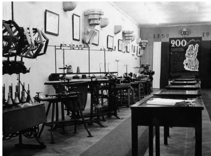
Výstava 200 rokov textilného priemyslu v B. Štiavnici

V dňoch 24. a 25. mája 2019 sa na Starom zámku uskutočnil 22. ročník Festivalu kumštu, remesla a zábavy. Najviac navštevovaným podujatím v rámci jeho programu bola módna prehliadka značky