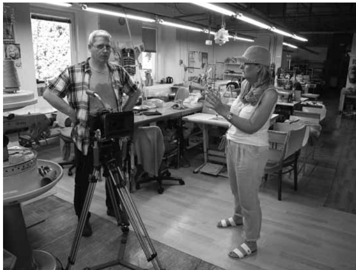
Filmovanie v priestoroch podniku Svetro

Za krátky čas niekoľkých mesiacov sa podarilo nájsť spôsob, ako projekt financovať, vytvoriť pries-