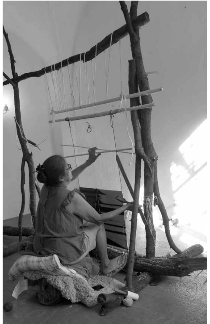
Pri tkaní v ateliéri TROJICA

tradícii, ktorá sa vinie cez viac ako päť generácií. Marilou tká tradičné aj súčasné Navaho prikrývky a koberce a používa pri tom prírodnú ovčiu vlnu. Je známa svojou precíznou technikou, nesymetrickými vzormi a svojim experimentálnym prístupom k zaužívaným Navaho obrazcom a farbám.