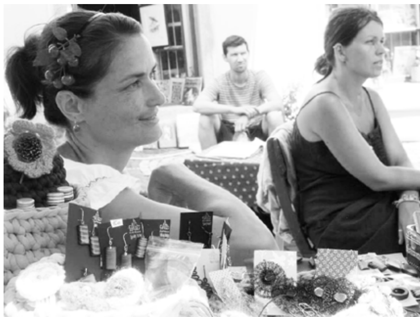
Aj domáci rozširujú okruh zručných remeselníkov

Prajem Vám naďalej veľa úspechov a množstvo vydarených akcií. S pozdravom. Kováčová „ My ďakujeme všetkým, ktorí sa akýmkoľvek spôsobom zaslúži-