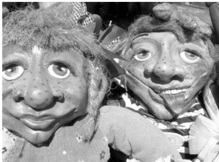
Kreativita bez obmedzení

„Chcem sa Vám i touto cestou veľmi krásne poďakovať za možnosť zúčastniť sa krásnej akcie, akou sú Nezabudnuté remeslá. I vďaka Vám, veľmi dobrej organizácii, sme prežili veľmi príjemný deň.