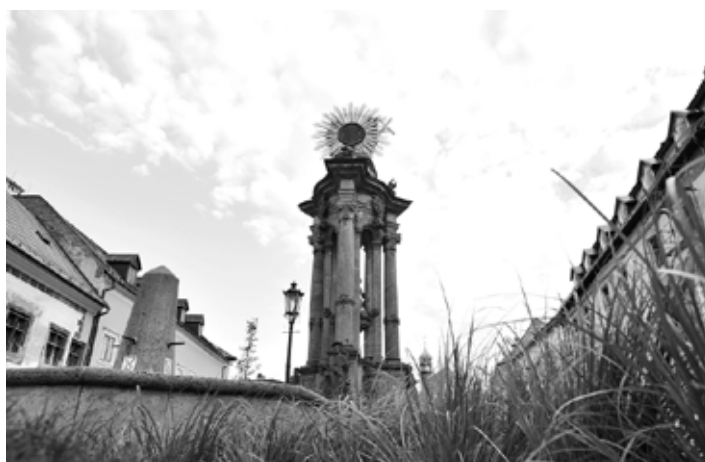
Námestie sv. Trojice

„V minulom roku naše námestie oživil ostrovček vytvorenej zelene a malé pódia spolu so stromami. Medzi obyvateľmi nášho mesta táto zmena vyvolala zo začiatku aj negatívne ná-