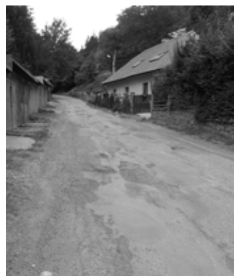
Ul. Zigmund šachta