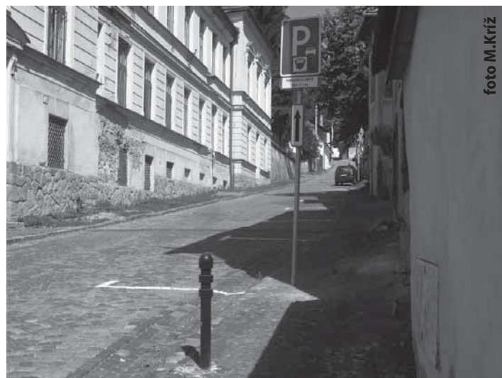
Vytvorenie nových parkovacích miest na Nám. sv. Trojice oproti bývalej Centrálke.