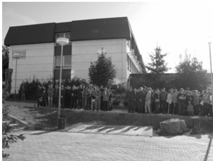
Začiatok nového školského roka na Spojenej škole

Vážení rodičia, zverili ste to najcennejšie čo máte školám, o ktorých ste presvedčení, že poskytnú Vaším deťom nielen výchovu a vzdelávanie, ale aj odborne a ľudsky kompetentný personál, podieľajúci sa na pokojnej a priateľskej