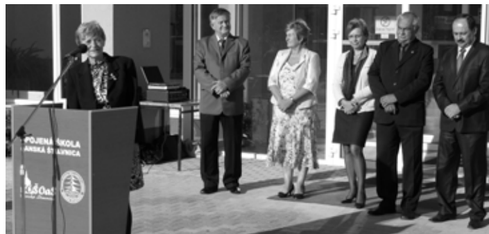
Slávnostné otvorenie školského roku