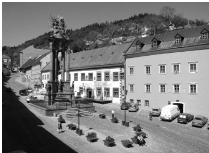
Nám. sv. Trojice

Historické mesto Banská Štiavnica a technické pamiatky prilahlého okolia sa tak dostali do excelentnej rodiny najvýznamnejších lokalít a solitérnych pamiatok sveta, akými už boli napríklad Rím, Vatikán, Jeruzalem, či Egypské pyramídy, Čínsky múr a ďalšie najvzácnejšie a najvýznamnej-