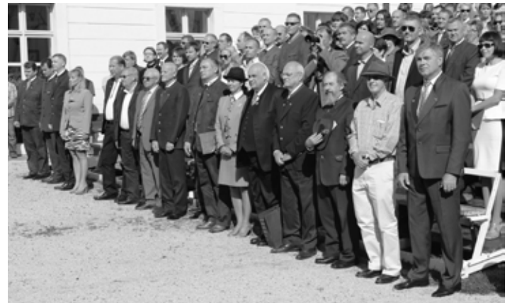
Vzácni hostia na nádvorí kaštiela

Dvojdnový program slávností bol zaujímavý nielen pre poľovníkov. Na svoje si prišli všetci milovníci prírody bez rozdielu pohlavia, či veku. Návštevníci si v rámci sobotnej ponuky mohli zasúťažiť v populárnych súťažiach, ako 5F, Naj brada, Poľovnícky šperk a nôž roka, Poľovnícky klobúk. Spomedzi prítomných nežného pohlavia sa volila Hájnikova žena – najkrajšia poľovníčka roku 2013. Poobede na nádvorí kaštiela sme spoznali aj nových Majstrov Slovenska vo vábení jeleňov a ostatnej zveri. Deťom