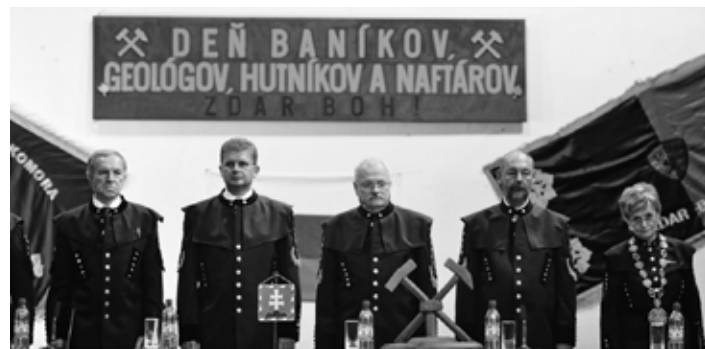
Vzácní hostia Salamandrových dní