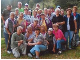
Účastníci prechádzky na Bačianskom tajchu.

Členovia a priaznivci SZŤP v Banskej Štiavnici sa na rozlúčku s tohtoročnou turistickou sezónou vydali na trasu ďalším nádherným kútom Štiavnica po trase Červená studňa – Hadová – tajch Banky – obec Banky.