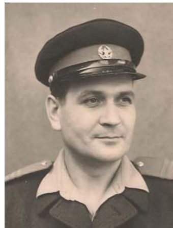
Športovec, dobrovoľný hasič.