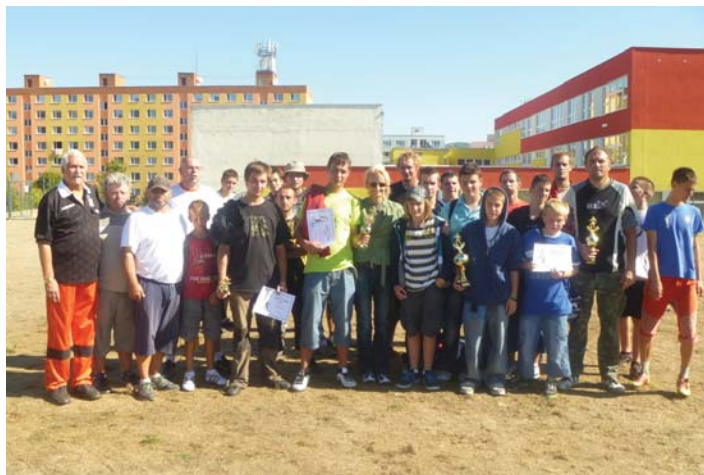
Účastníci futbalového turnaja.