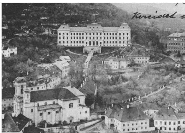
Budova Banickej akademie z roku 1906.

Dnes, keď sme sa spojili s SPŠ S. Mikovíniho (bývalou baníckou školou), sa udržali všetky naše životaschopné odbory chemické, geodetické, so zameraním na životné prostredie a ponuku umeleckých odborov sme rozšírili za posledné roky o študijné odbory: propagačné výtvarníctvo, propagačná grafika, dizajn – grafický a priestorový dizajn. Takže v súčasnosti počet našich žiakov študujúcich v umeleckých odboroch je skoro vyrovnaný s počtom žiakov technických odborov.