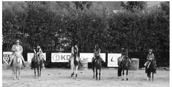
Začiatok Hubertovej jazdy FOTO LUBOMÍRA MARTEČIKOVÁ

Aj to bolo súčasťou sobotňajšieho programu dňa 3.10.2015 na Ranči Nádej vo Sv. Antone. Nosným programom boli dve akcie. Hubertova jazda sa realizovala mimo ranča v teréne. Počas nej jazdec Master udával smer ostatných jazdcov a jazdec Líška, práve opačne, mal za úlohu jazdcov oklamať v zmene smeru, či konaní. Veru, aj tento rok sa našli takí, čo sa dali. Tí potom boli potrestaní. Posledným súdom počas večernej tanečnej zábavy so skvelou country skupinou Orion z Hodruše - Hámmrov. Hon na líšku sa konal na stráni vedľa ranča. Líšku prvú dolapila a tím sa najrýchlejším jazdcom