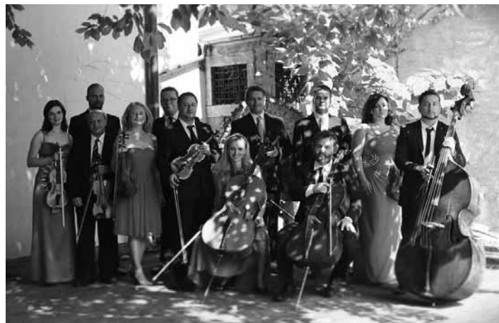
Členovia Hilaris Chamber Orchestra