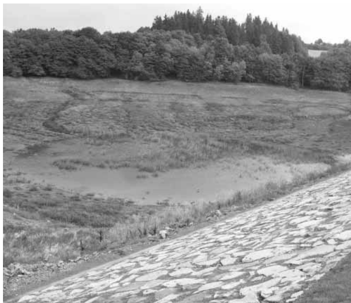
Súčasný stav Richňavského tajchu