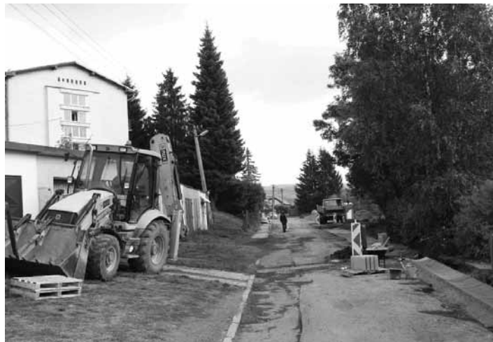
Stavebné práce na Povrazníku