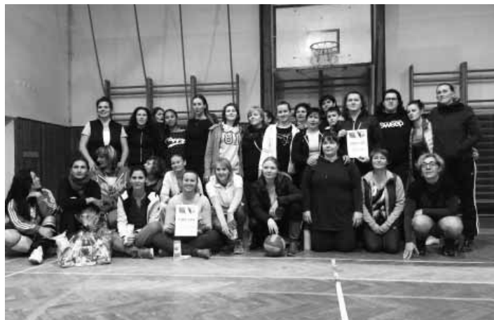
Tímy ženského volejbalového turnaja

Turnaj sa uskutočnil na ZŠ s MS M. Hella Štiavnické Bane, kde mali družstvá stráviť príjemný „volej- balový“ deň. Na turnaj bolo pozva- ných viacero družstiev. Bohužiaľ, nie všetky tímy sa ho mohli zúčast- niť. Nakoniec sa ich zišlo 6. Zostava družstiev bola nasledovná: 4 štiav- nické družstvá - Tena Lady Team, Renegátky, Šumienky a Skade- tade a 2 ne-štiavnické družstvá - Žiar nad Hronom a Zlaté Moravce. Tímy sa medzi sebou stretli v zápasoch, ktoré pozostávali z 2 hraných set- tov do 20 bodov. Set končil pri poč- te 20 bod. Každý z tímov odohral 5 zápasov. Zápas boli zaujímavé a väčšinou veľmi vyrovnané. Sved- čia o čom aj výsledky zápasov, ko- ré sa pohybovali v rozhraní výsled- kov 14:20 až 19:20. Tímy sa počas prestávok mohli občerstviť nápojmi a sily doplniť rôznymi koláčmi, sla- ným pečivom, nátierkami. Upekli a pripravili ich samotné organizá-