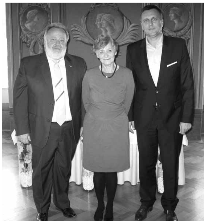
Prijatie predsedu SNS na radnici

Pracovné stretnutie sa nieslo v priateľskej atmosfére a družnej debata o možnostiach spolupráce a pomoci pre okres a mesto Banská Štiavnica. Opýtali sme sa na kroky, ktoré privedli Andreja Danka do Banskej Štiavnice: „Do Banskej Štiavnice chodím veľmi rád. Banskú Štiavnicu vnímam v historickom kontexte ako každý Slováka a o to viac, že v Banskej Štiavnici je energia, ktorá ma upokojuje, podobne ako napr. v Salzburgu. Obidve mestá majú svoju históriu, kultúru a svoje dejiny spojené s baníckou ťažbou zlata, striebra a soli. Banskej Štiavnici treba podať pomocnú ruku ako čo najviac prilákať turistov. Štiavnica je odkázaná na rozvoj turistiky, cestovného ruchu a osobne si myslím, že by aj naďalej mala ísť touto cestou. Myslím si,