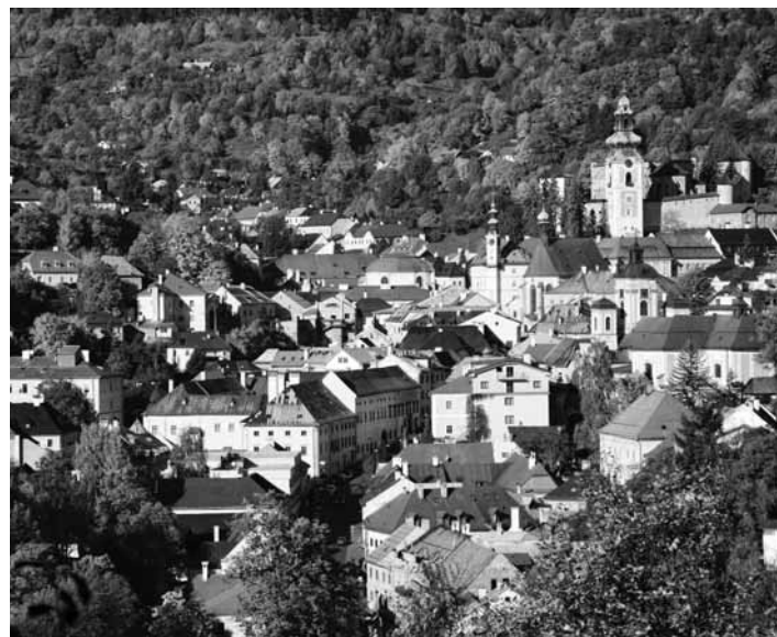
Dialkový pohľad na mesto