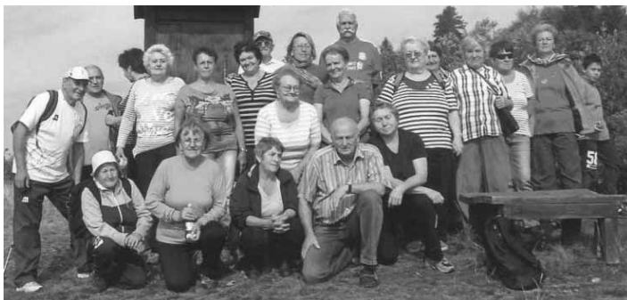
Účastníci jesennej prechádzky

Zúčastnilo sa jej 21 turistov, ktorí uverili v malý zázrak, keď predtým večer a v noci lialo ako z krhly a ráno ich čakalo pekné počasie. Prechádzku zahájili na Pecinách, prešlo sa okolím Richňavského jazera a prezreli sa územia partizánskych štôlní. Po výstupe do vyššie položenej lokality boli odmenení nádherným výhľadom na tajchy Bakomi, Vindšachta a Evička. Pokračovalo sa katastrom Košiar doliny. Nasledovala návšteva Základnej deväťročnej školy v Štiavnických Baniach a hlavne prehliadka nádherného areálu, koní, vtáctva s odborným