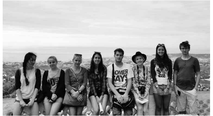
Gibraltár a študenti SPŠ S. Mikovíniho

Malaga nás privítala slnečným dovolenkovým počasím, a tak sme hneď po príchode išli okúsiť vlny Stredozemného mora. Na druhý deň žiaci absolvovali vstupné pohovory vo firmách, kde mali vykonávať pracovnú stáž, zároveň sa museli naučiť cestu do práce a z práce domov. Dve študentky odevného dizajnu praxovali vo vychytených módných salónoch, kde sa pripravovali modely na veľkú módnú prehliadku, ktorú prenášala aj španielska televízia. Naše štvrtáčky príjemne prekvapili svojimi praktickými zručnosťami a samostatnosťou, ktorú aj počas prehliadky využili, čo bola jedinečná pracovná skúsenosť. Študentky životného prostredia trávili prax v nádhernom morském múzeu, kde sa starali o choré korytnačky a iné zvieratká, dokonca sprevádzali turistov po múzeu. Študenti propagačného výtvarníctva sa ocitli vo firme, ktorá vyrábala umelecké a propagačné predmety. Výborne sa osvedčili, za čo im umožnili potlačiť si tričko vlastným dizajnovým návrhom. Študent biotech-