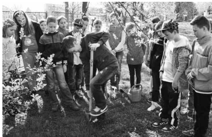
Sadenie stromčekov

škôl takmer zdvojnásobil, projekt sa rozšíril do mnohých kútov Slovenska a 58 moderne zmyslajúcim školám sa napokon úspešne podarilo zachrániť vyše 8 tisíc stromov. Aj 3. ročník projektu prináša niekoľko inovácií. V povinnej aktivite sa žiaci a učitelia popasujú s aktuálnou témou Negatívny vplyv čiernych skládok na život v lese, ktorú budú môcť oživiť a predstaviť svojim spolužiakom, rodičom a verejnosti prostredníctvom výtvarných prác, 3D modelov, projektov alebo esejí. Práce budú vystavené na vyhodnotení súťaže s názvom Stromy vo vašich rukách, opäť v júni, kedy organizátori predstavia aj mená výhercov. Vďaka projektu malí i veľkí nezabúdajú, že separovaním papiera a následnou recykláciou sa podieľajú na záchrane stovky či tisíce stromov, zelených oáz, ktoré neslúžia len ako miesto odychu či ako domov mnohých zvierat a rastlín. Vďaka stromom dýchame čistejší vzduch. Neustále narasta-